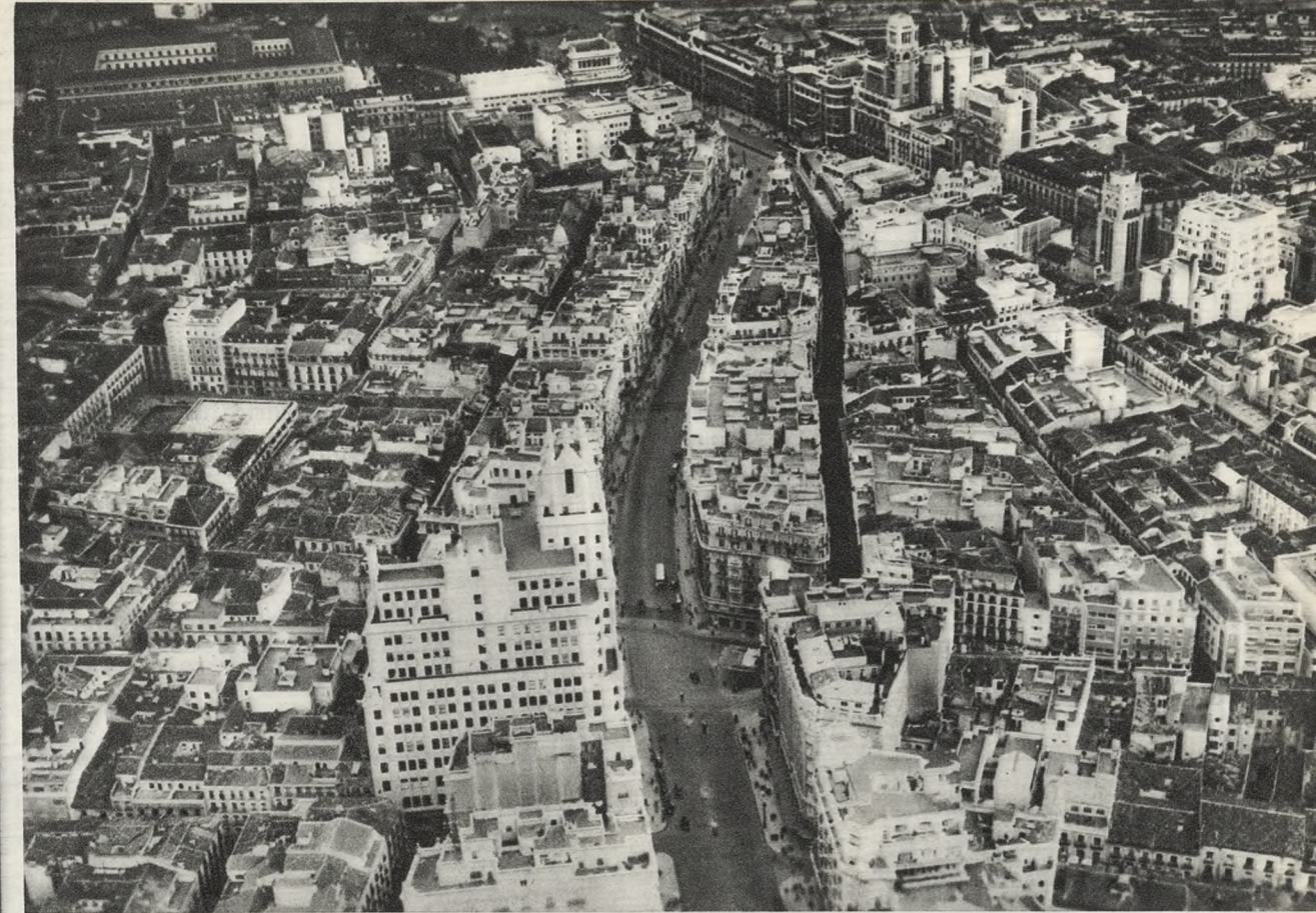
Vista aérea del primero y segundo trozos de la Gran Vía de José Antonio. En primer término, la Telefónica. Al fondo, a la derecha, sobre la calle de Alcalá, los altos edificios del Banco Vitalicio, «La Unión y el Fénix» y el Círculo de Bellas Artes, los relativos «rascacielos» de la bella capital española.