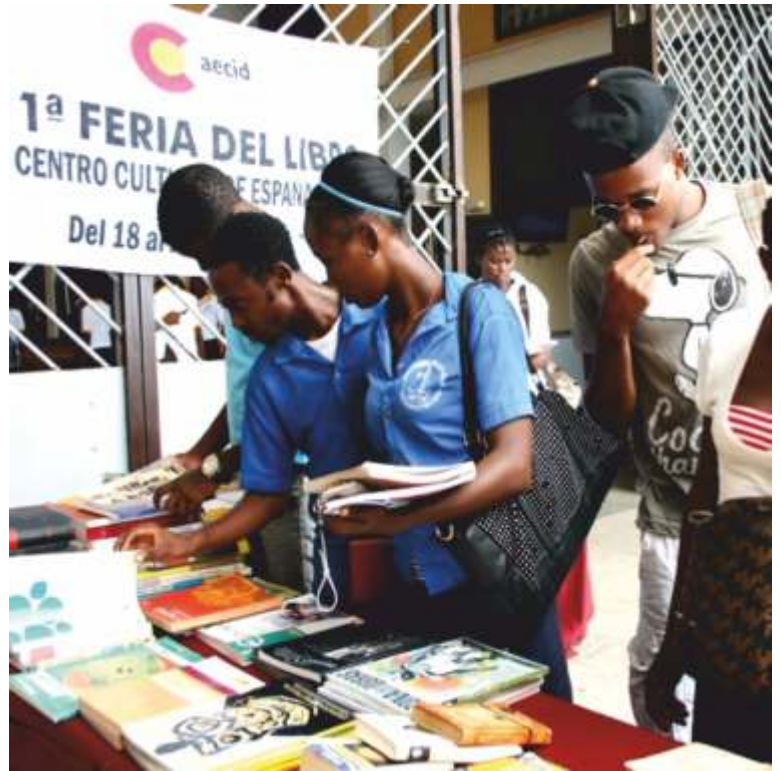
Clientes de la I Feria del libro de la ciudad de Bata que el CCEB desarrolló del 18 al 23 de abril

En los próximos meses, el CCEB cubrirá este importante vacío en la industria literaria del país con la inauguración de la primera librería de la región continental, que contará con una gran variedad de obras tanto nacionales como internacionales y que se ubicará en las instalaciones del CCEB.