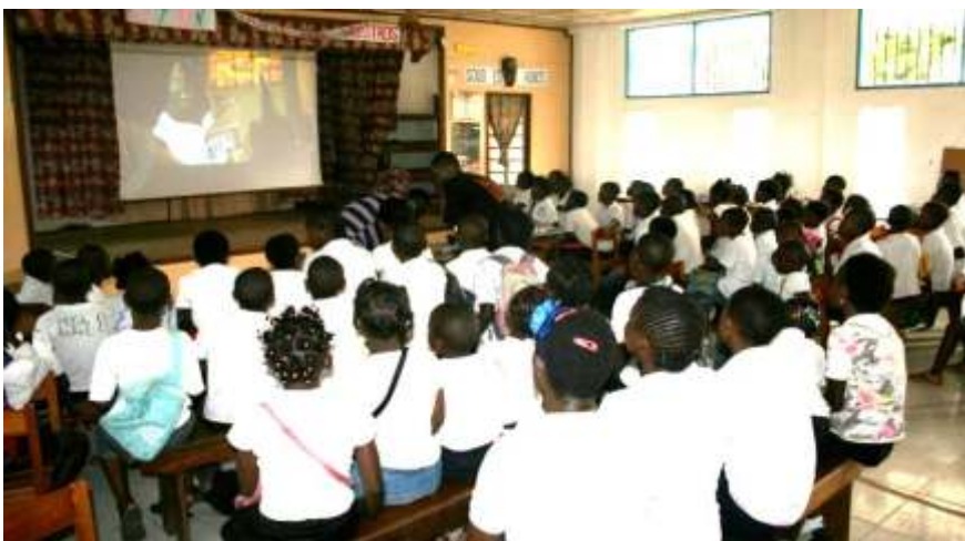
Alumnos y alumnas visionando uno de los cortometrajes ecuatoguineanos a concurso