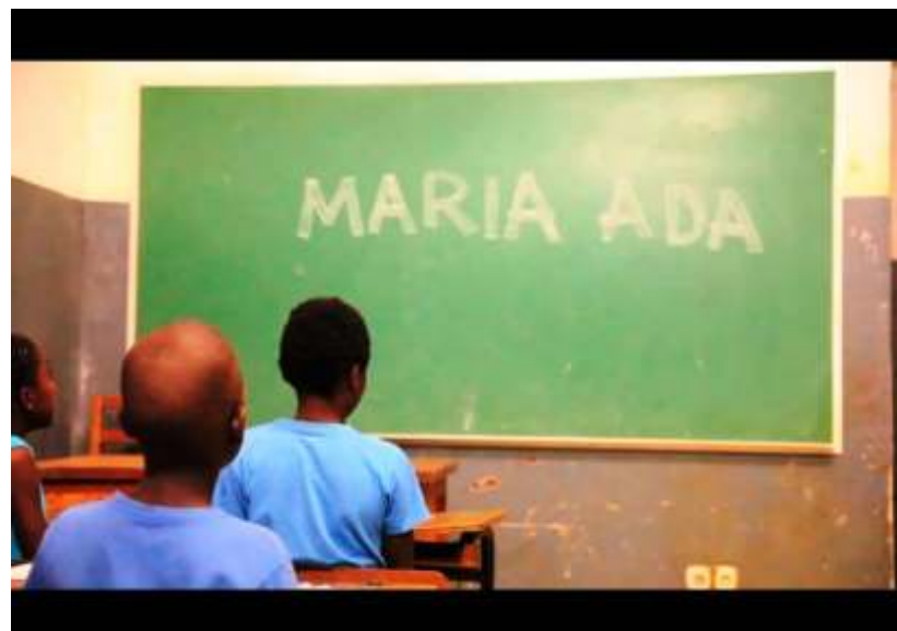
Frame del cortometraje "María Adá" ganador del Premio Ceiba a la mejor producción audiovisual ecuatoguineana