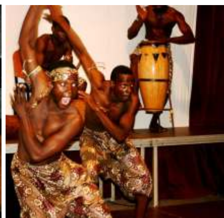
Arriba: Varios momentos del acto de clausura de FECIGE Abajo: Alumnos del taller de Géneros de TV, junto al profesor