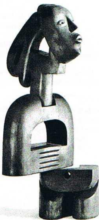
Homenaje a Black Gazelle L. Mbomio