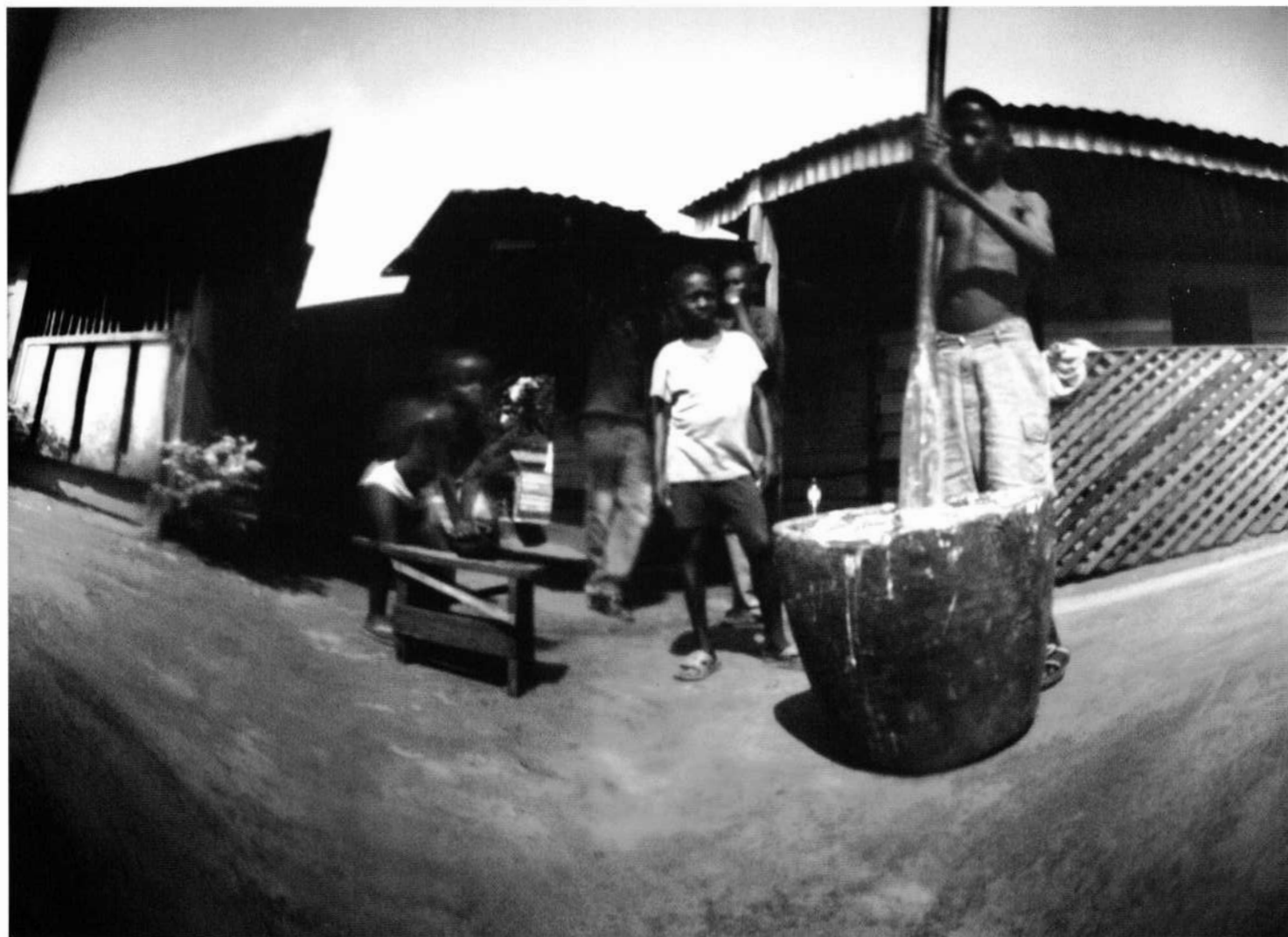
La vie au quotidien | La vida cotidiana