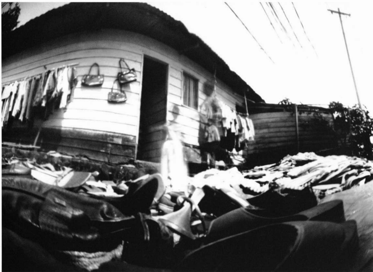
Le ghetto perdu | El ghetto perdido