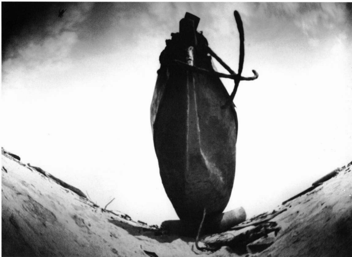
Le trésor du pêcheur | El tesoro del pescador