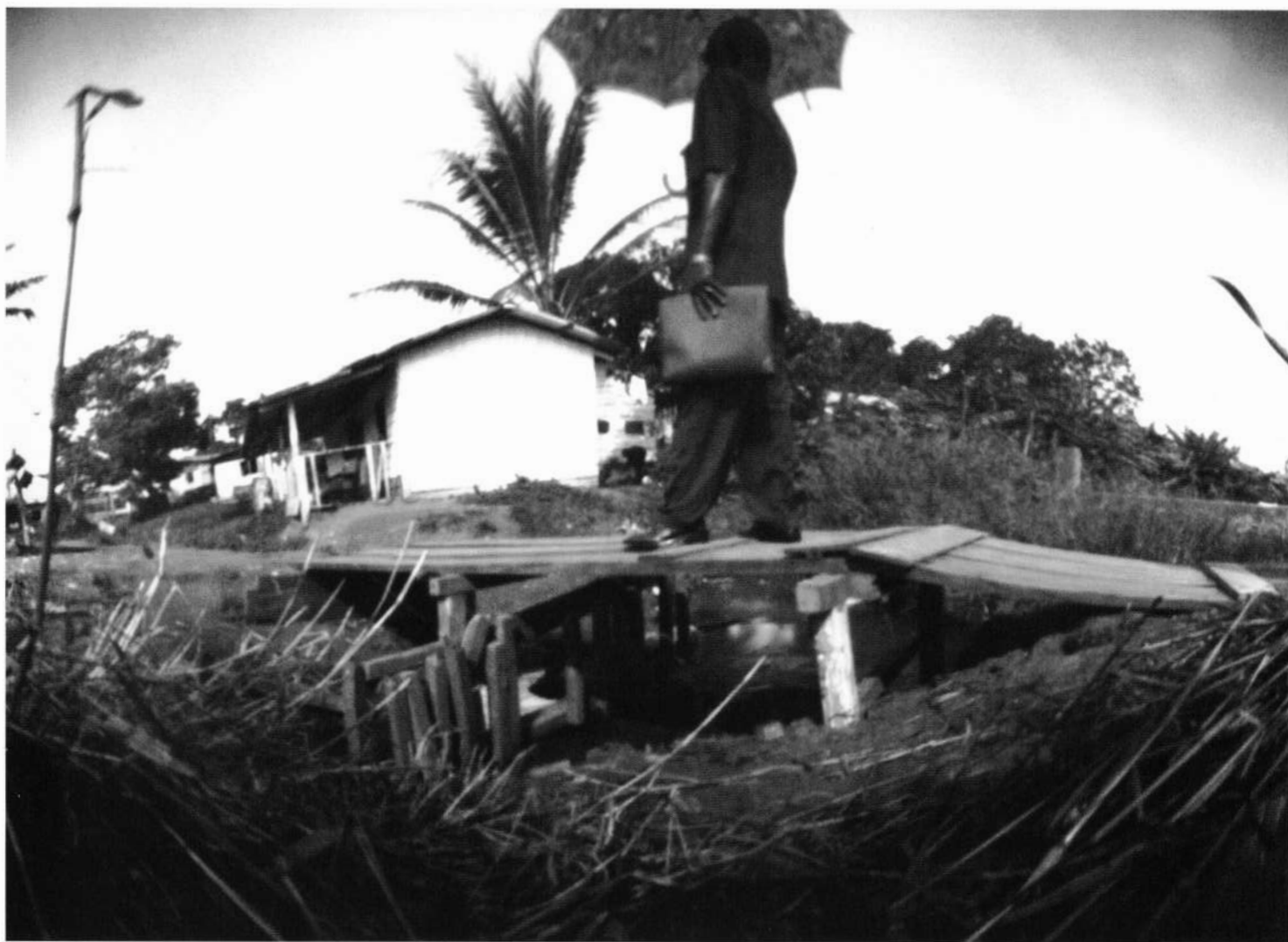
Le pont d'or | El puente de oro