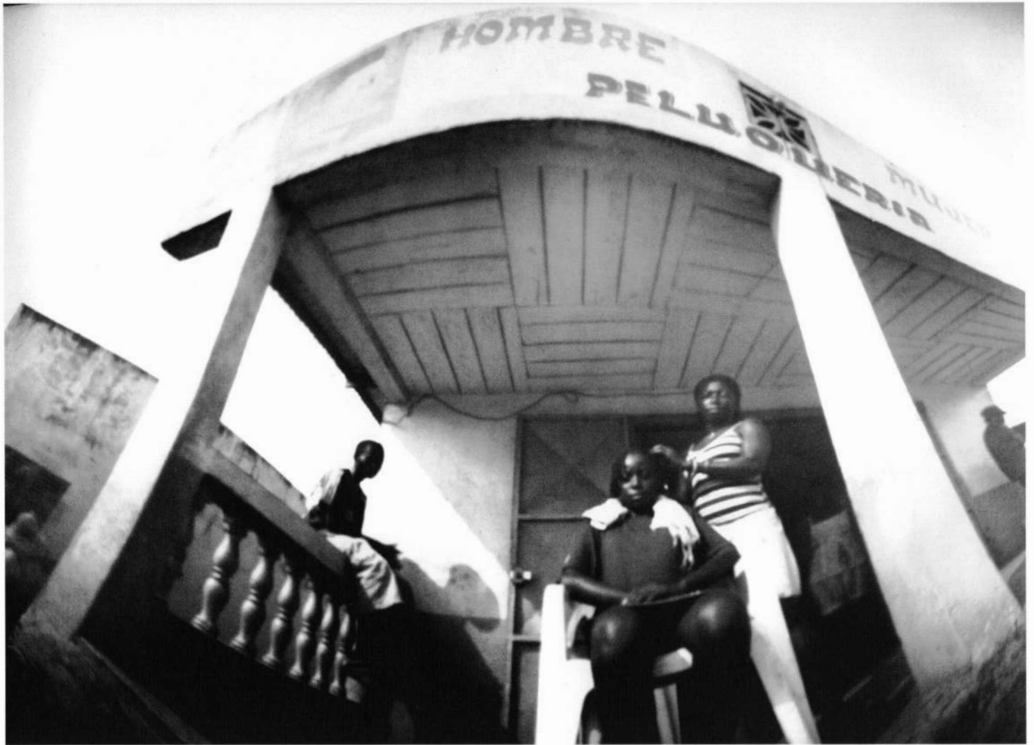
Femme et beauté | La mujer y la belleza