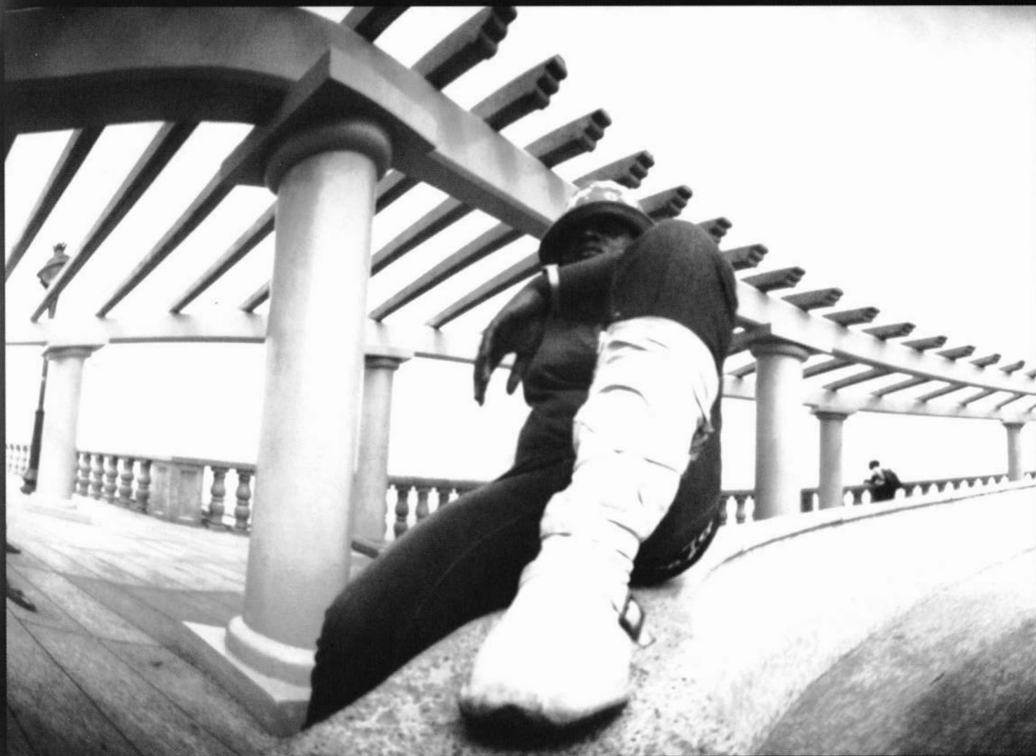
La fille à la botte | La niña de la bota