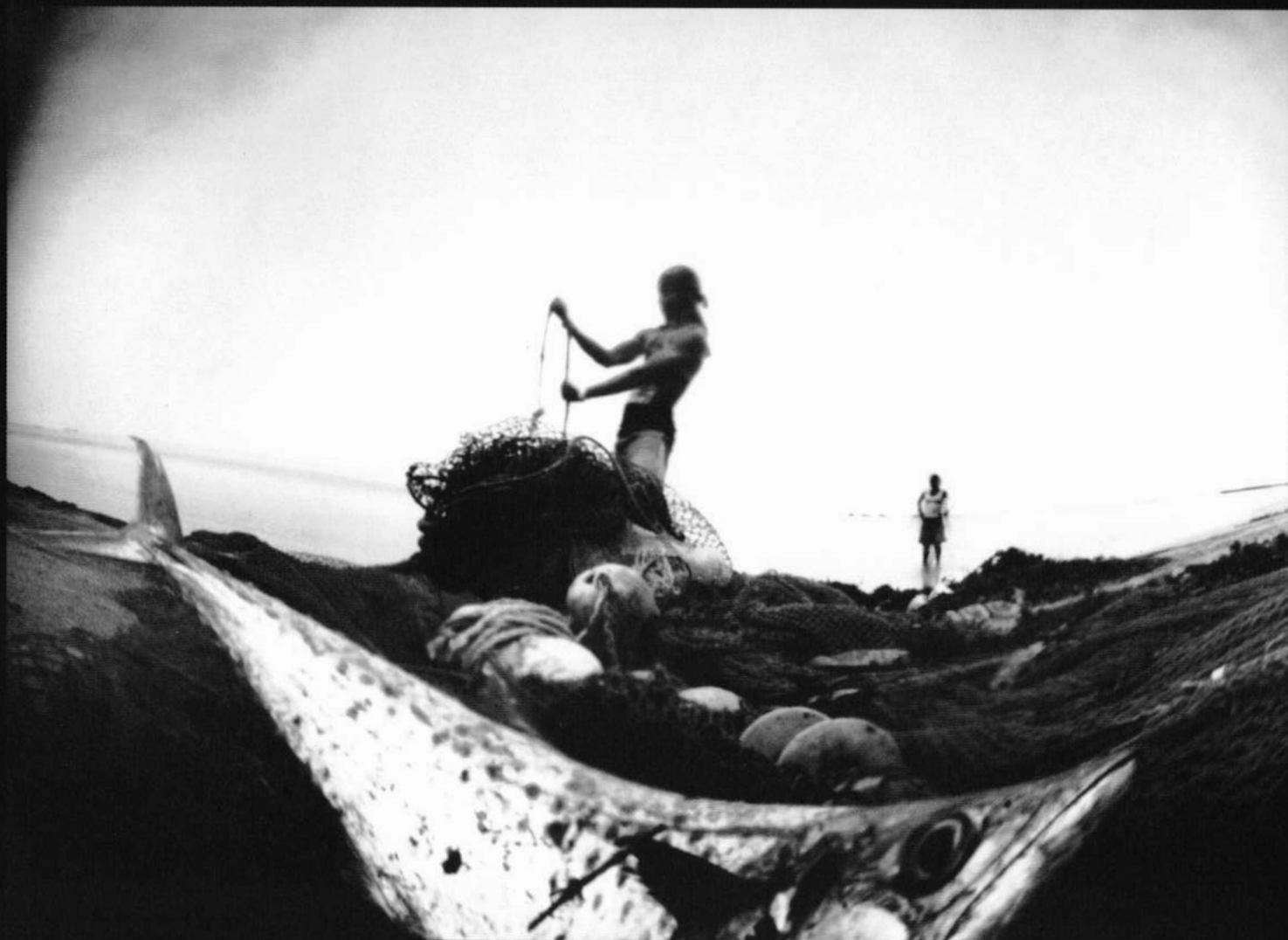
Le pirate Barbe-maquereau | El pirata Barba-chicharro