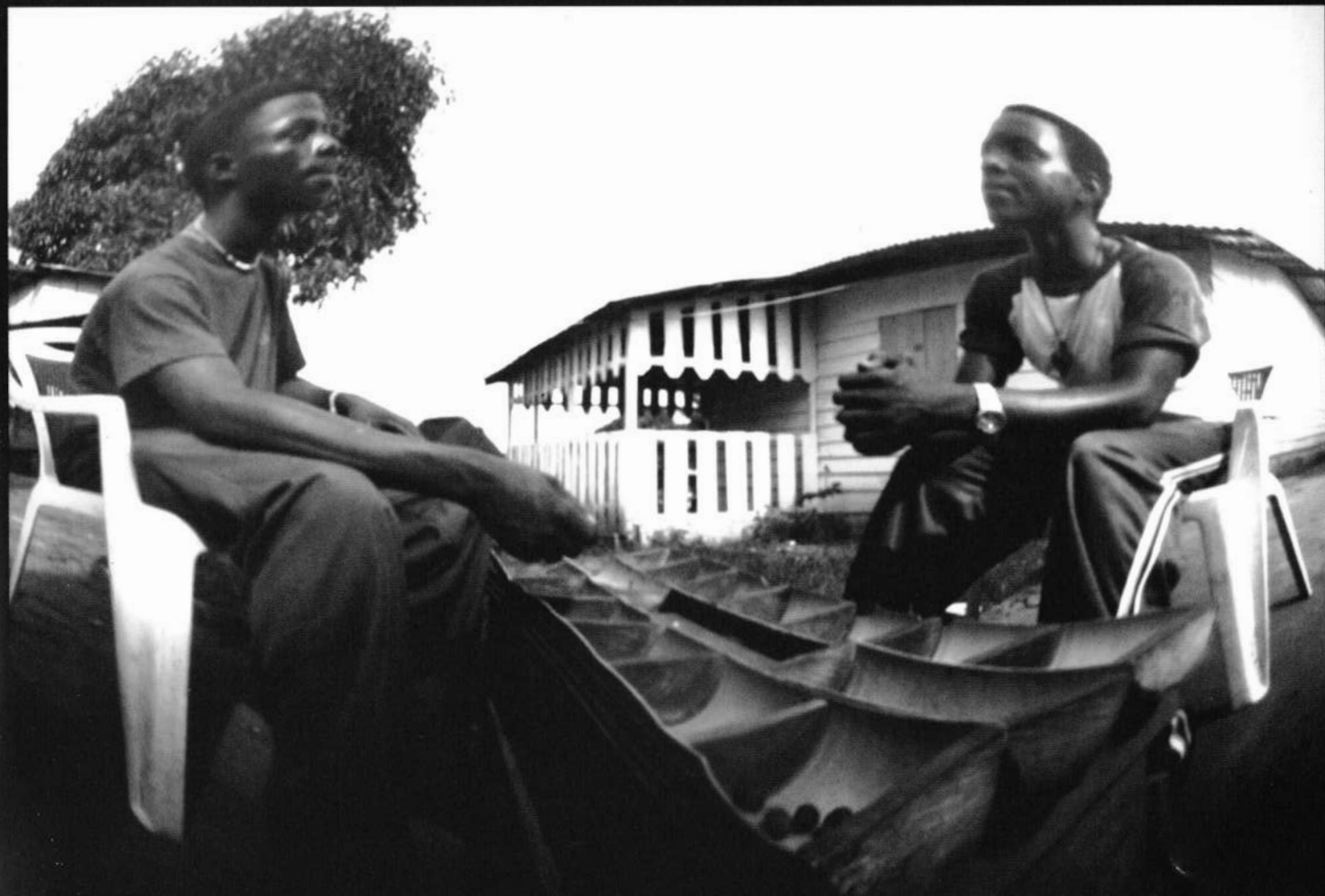
L'akong : le fameux jeux traditionnel | Akong : el famoso juego tradicional