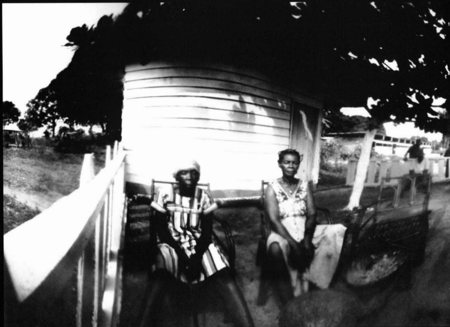
Témoins du passé | Testigos del pasado