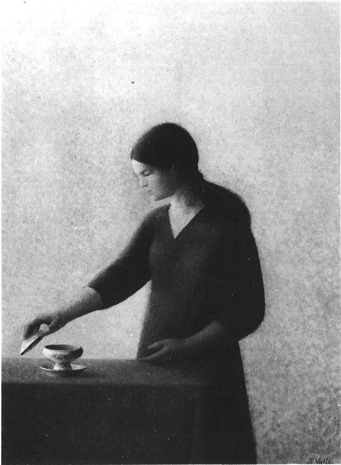
VALLS: «Pandora», colección Sardá, Barcelona (1968).