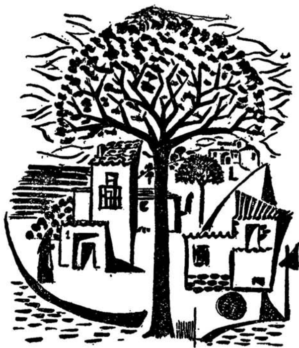
BRUJULA DE ACTUALIDAD