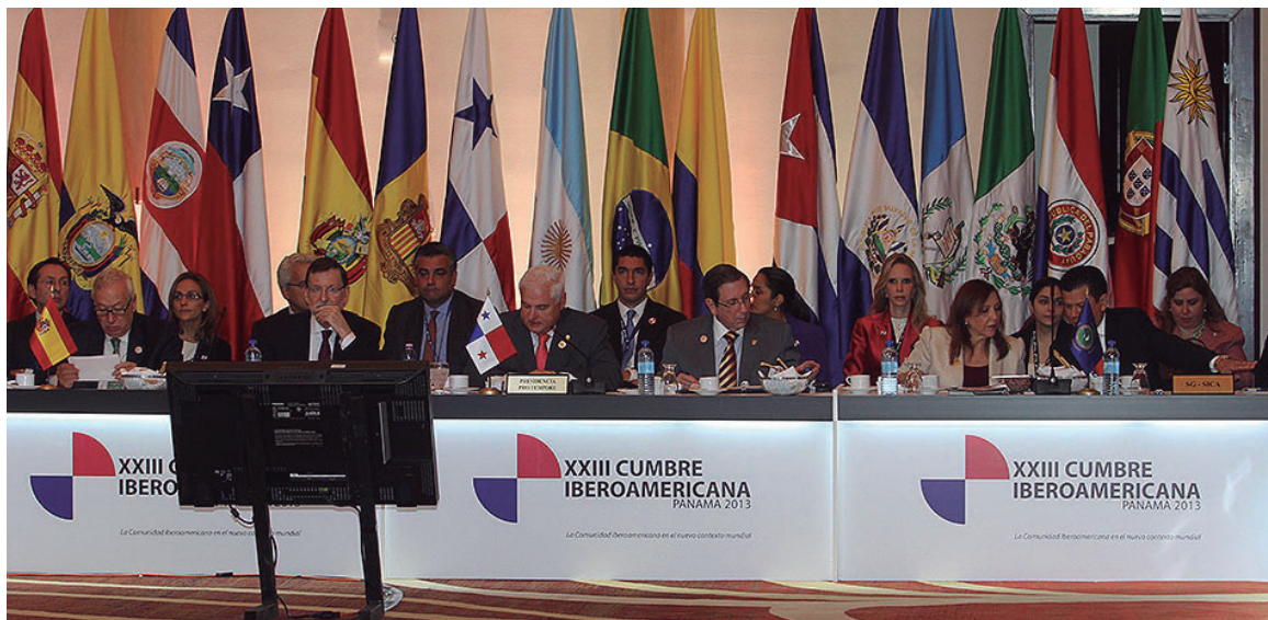
Reunión del Presidente Mariano Rajoy con los Presidentes centroamericanos y el Secretario General del SICA.