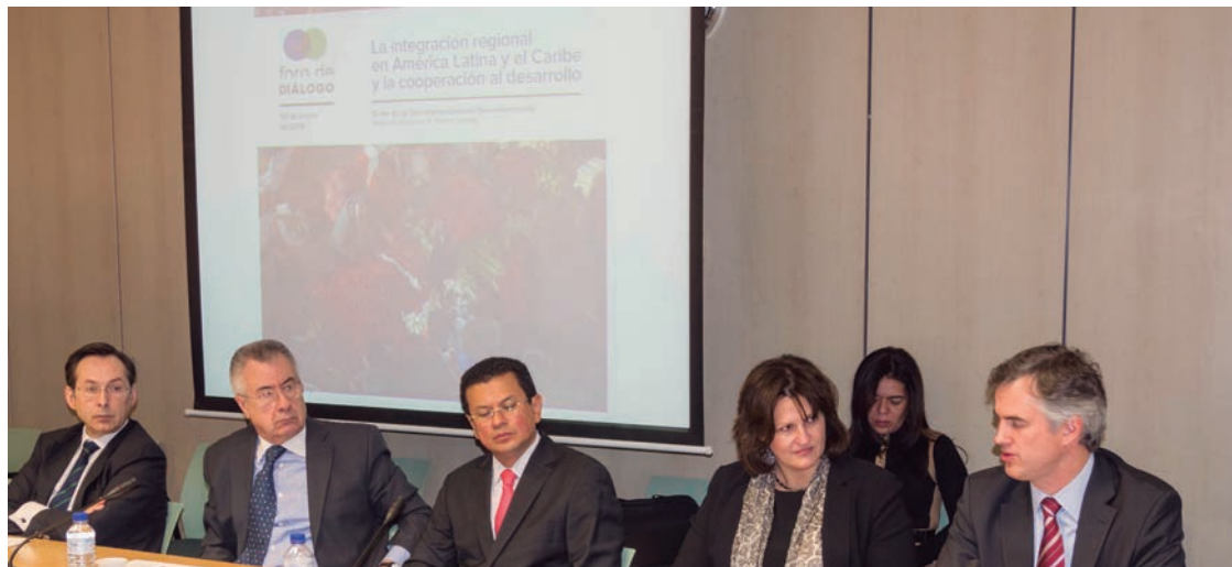
Foro de diálogo sobre la integración regional en América Latina y el Caribe y la cooperación al desarrollo