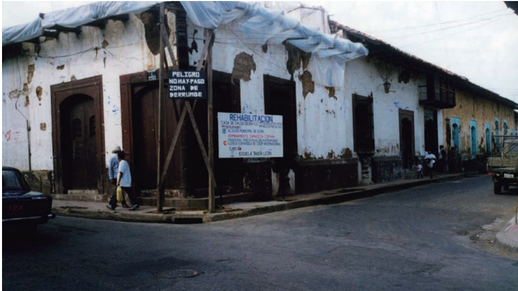
El huracán Mitch asoló Centroamérica en 1998.