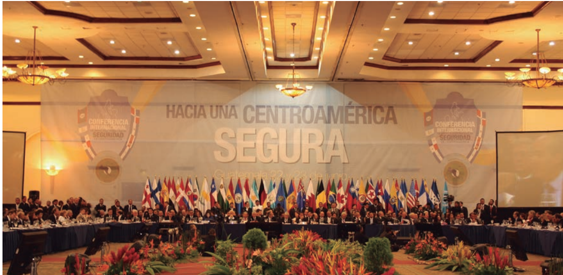
Conferencia Internacional de Apoyo a la Estrategia de Seguridad de Centroamérica