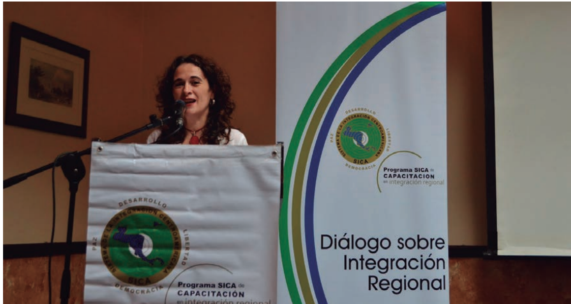
Programa SICA de Capacitación en Integración Regional