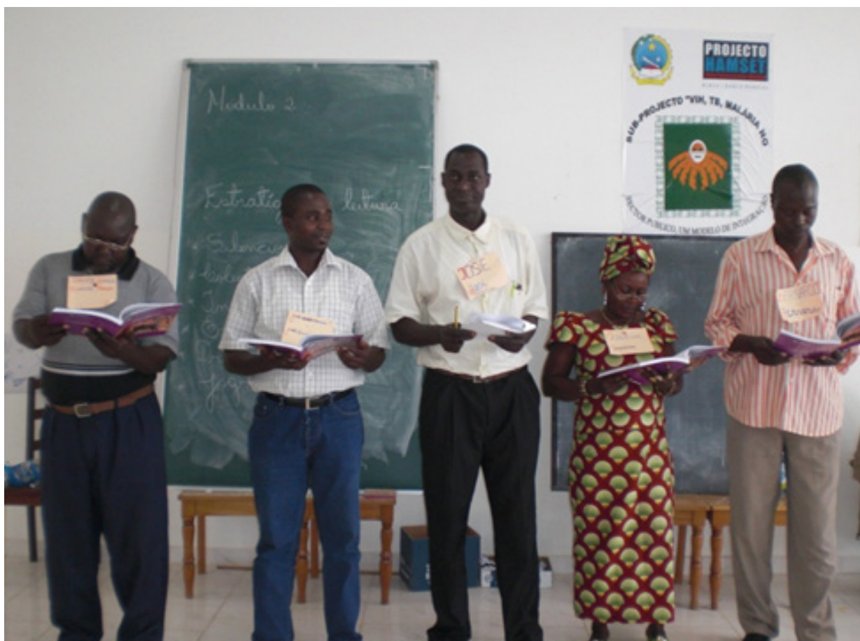
Fotografia 2: Cursos de alfabetização do Ministério da Educação / Cursos de alfabetização do Ministério da Educação

las provincias de Luanda, Benguela y Malanje) y en el equipamiento y la formación del personal de una nueva Unidad Gráfica dentro del Ministerio de Educación de Angola, así como en la formación técnico-profesional y en la inserción laboral y socio-cultural de los jóvenes. En materia de cooperación interuniversitaria, destacan los proyectos de agroindustria y silvicultura realizados con la Universidad José Eduardo dos Santos de Huambo (el primero realizado con Asistencia Técnica de la Universidad Autónoma de Barcelona y el segundo con la Universidad de Córdoba) y la creación de un foro de intercambio y aprendizaje permanente sobre la gestión universitaria entre universidades españolas y africanas para aumentar sus capacidades institucionales. En estrecha relación con este proceso de mejora de la formación y las capacidades de los cuadros y recursos humanos del país, cabe destacar las becas MAEC-AECID de postgrado concedidas a estudiantes angoleños para su