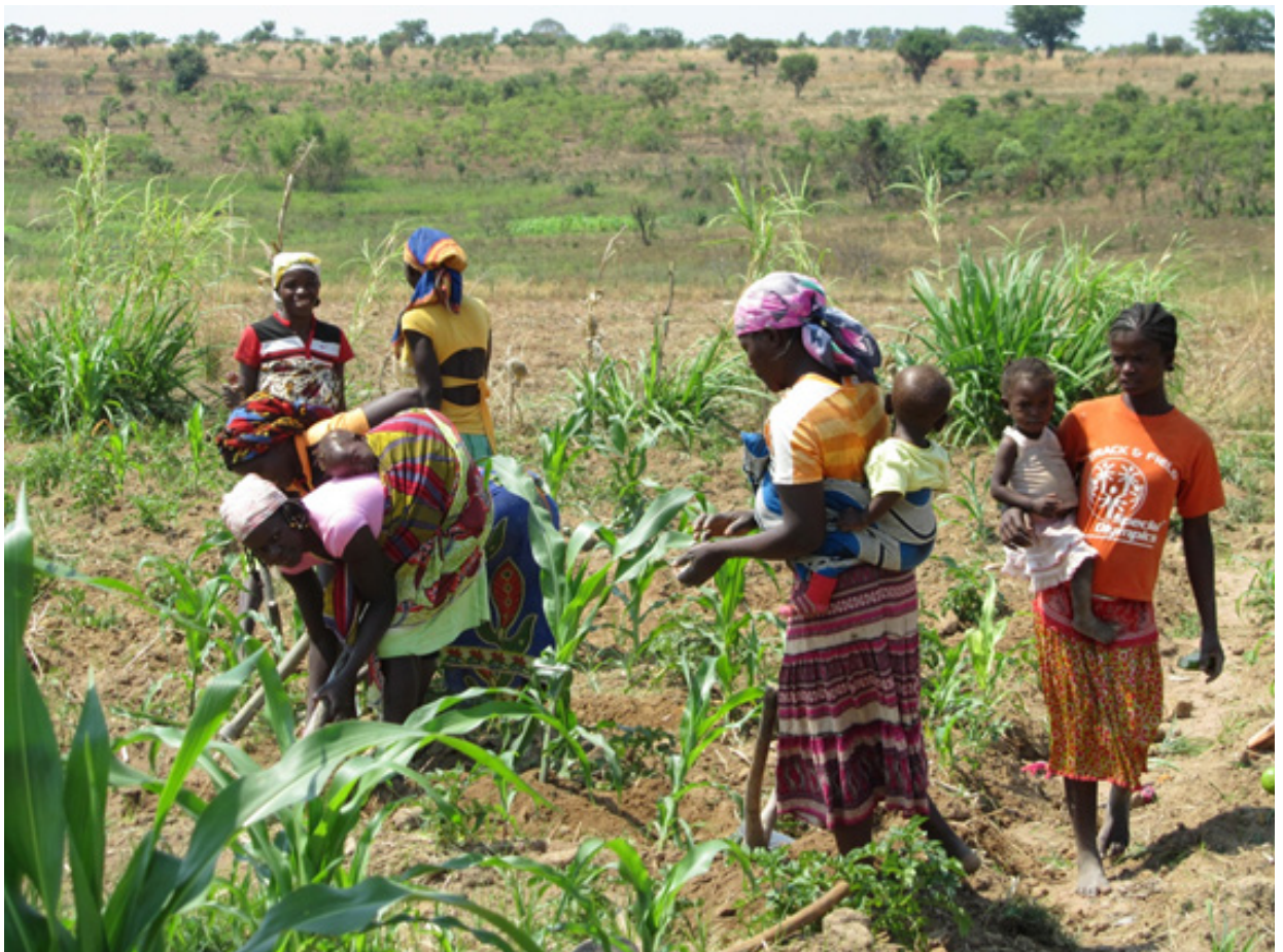
Fotografía 1: Projetos de segurança alimentar e desenvolvimento agrícola / Projetos de segurança alimentar e desenvolvimento agrícola

As intervenções iniciais neste setor foram muito numerosas (nomeadamente através de mecanismos multilaterais como o PMA e a FAO), ativas e voltadas para a Ajuda Humanitária, devido à situação de conflito em que o país se encontrava e à necessidade de fazer face a situações de emergência e pós-emergência que afetavam as necessidades básicas de alimentação de uma parte muito elevada