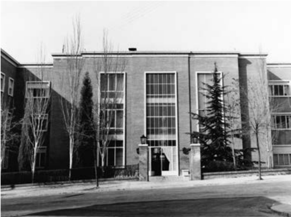
Primera sede del Instituto Hispano-Árabe de Cultura.

Cuando desempeñaba el puesto de directora de la Biblioteca Islámica “Félix María Pareja”, se me pidió un artículo para la Miscelánea de la Biblioteca Española 1 , en el que se reflejara la creación y desarrollo de sus fondos. Así lo hice, y se publicó en el año 1992.