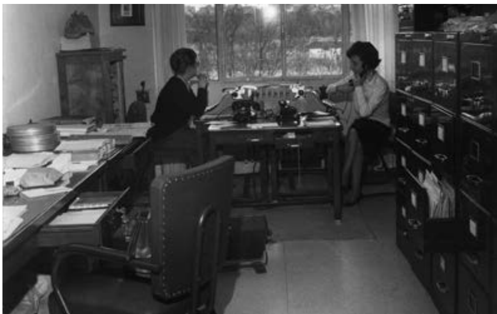
Oficinas del IHAC en la calle Límite, hoy Paseo Juan XXIII.