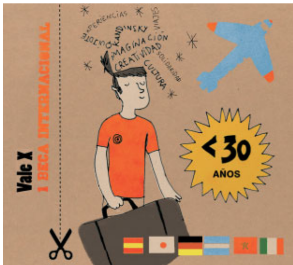
Ilustración: Candela Ferrández

Formar ciudadanos con perspectivas, habilidades y sensibilidades hacia la cooperación cultural es lo que persigue esta aventura anual que comienza cada mes de julio para algunos jóvenes. ¡A todos ellos les damos la bienvenida en sus nuevos destinos!