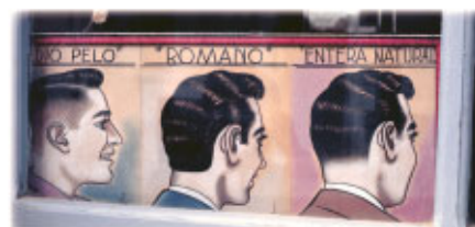
Exposición Tutti Frutti. Gráfica Popular y Diversidad Cultural