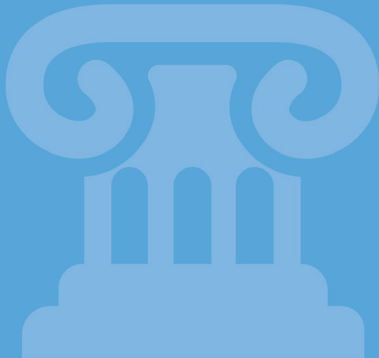
Figura 26. Cronología de legislación nacional e internacional referente a las violencias basadas en género contra las mujeres

Ratifica la Convención sobre la eliminación de todas las formas de discriminación contra la mujer (CEDAW) .