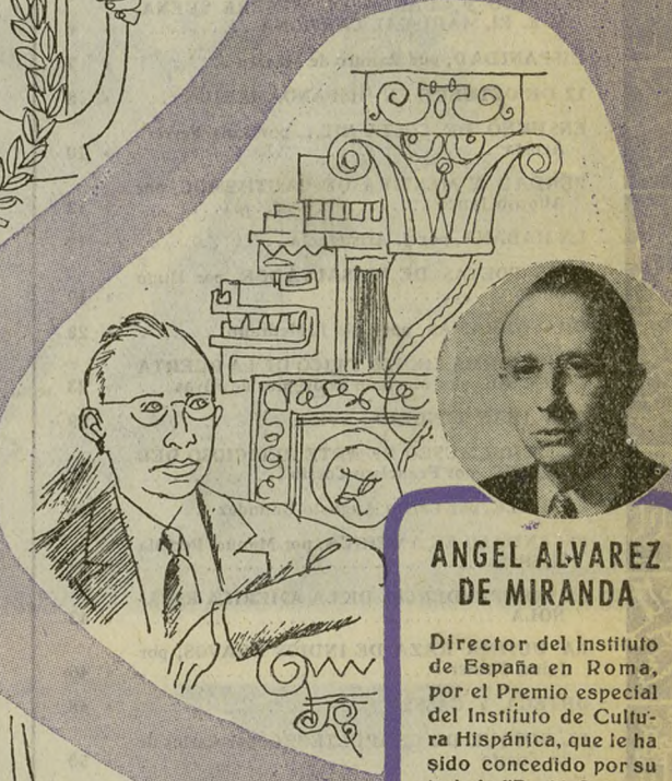
ANGEL ALVAREZ DE MIRANDA

Poeta y escritor chileno, a quien el Instituto Chileno de Cultura Hispánica ha rendido un homenaje por haber obtenido recientemente el Premio Nacional de Literatura, máximo galardón literario de su país.