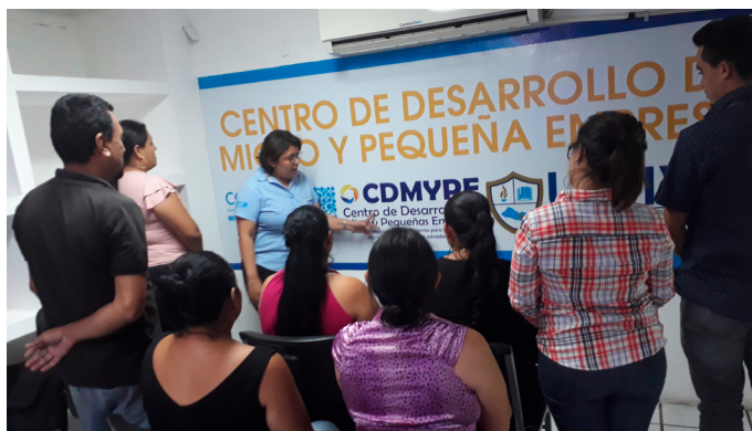
EDUCO: proyecto con desplazados por violencia, El Salvador

En el caso de Colombia , sigue habiendo muchas personas con necesidades humanitarias : 5,1 millones, según el HRP de 2019. Cabe señalar que Colombia está incluida en el Índice de Crisis Olvidadas, 2019; su invisibilidad se ha agudizado por la gran repercusión mediática de la crisis de Venezuela y los flujos mixtos en la región. Los principales impulsores de las necesidades humanitarias siguen siendo el conflicto y las nuevas dinámicas de la violencia armada: en el primer semestre de 2019 ha habido 1.089 ataques a civiles y persiste el desplazamiento forzado y el confinamiento.