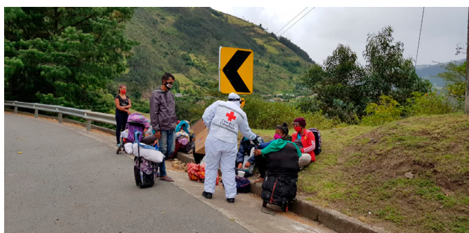
Cruz Roja Colombiana: respuesta a personas migrantes venezolanas en Colombia afectadas por COVID19

En el ámbito regional las necesidades se refieren fundamentalmente a dos cuestiones. Por un lado, la gestión y reducción del riesgo de desastres, y por el otro, la coordinación. En el caso de la respuesta a desastres , a pesar de los avances en el sistema regional, la falta de recursos estables o las dificultades geográficas -especialmente en caso de un desastre de gran magnitud o de varios desastres menores simultáneos-, requieren de una respuesta internacional complementaria. La Federación Internacional de la Cruz Roja (FICR) apoya el fortalecimiento de las capacidades de las Sociedades Nacionales en el continente, y la Oficina de Naciones Unidas para la Reducción del Riesgo de Desastres (UNDRR) trabaja en reforzar mecanismos regionales y nacionales de coordinación para monitorear y acelerar la implementación del Marco de Sendai. Otro aspecto clave es la necesidad de potenciar la preparación y respuesta a emergencias en salud , tomando en cuenta además el resurgimiento de numerosas enfermedades infecciosas. Para tal fin, la Organización Panamericana de Salud (OPS) es un socio clave.