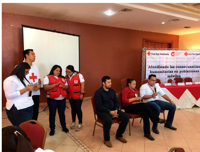
Cruz Roja Española, foro de migrantes y desplazados, Honduras

El primer eje que aborda la preparación para y respuesta a desastres es una línea tradicional y la más permanente. Abarca toda la región, pero tiene su foco principal en la cuenca del Caribe donde se concentran muchos riesgos y la mayor parte de los huracanes, terremotos y otros desastres naturales.