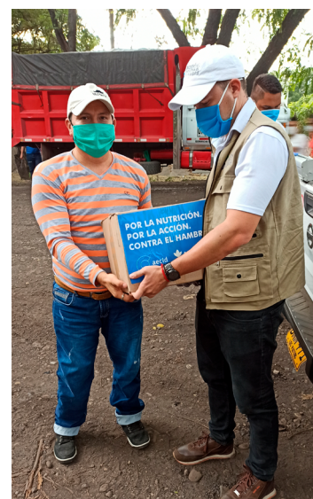
Fundación ACH: asistencia alimentaria a personas migrantes venezolanas en Colombia

Se diferencia de otros contextos humanitarios que atiende la Cooperación Española en que se agrupan varios contextos interrelacionados en uno solo, pues la acción humanitaria española opera con una lógica regional a la vez que nacional y subnacional para abordar una realidad compleja. Esta mirada define los dos ejes alrededor de los cuales se ordena la acción humanitaria española. El primer eje se refiere a la preparación para dar la respuesta a desastres desde una perspectiva regional, pues se trata de reforzar las capacidades de todos los países y atender, con los recursos disponibles, las necesidades humanitarias de eventos que requieren apoyo internacional. En general, América Latina y el Caribe se destaca en el mundo en desarrollo por su relativamente alta capacidad institucional -incluyendo una sociedad civil muy comprometida-, con lo cual los países pueden responder adecuadamente a muchos desastres menores. Esta zona se destaca por su entramado rico de organismos regionales y subregionales que promueven la cooperación entre países en diversos ámbitos, incluyendo aquellos relacionados con la prevención de riesgos y la acción humanitaria. Ante la creciente complejidad del entorno y de los riesgos climatológicos y de otros tipos, es necesario fortalecer esas capacidades tanto estatales como de la sociedad civil, un objetivo en el que la cooperación internacional puede desempeñar un papel relevante.