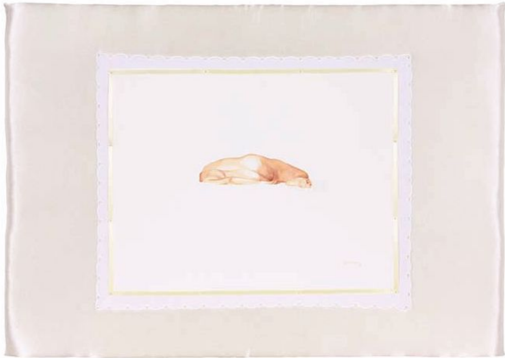
El cuerpo del delito