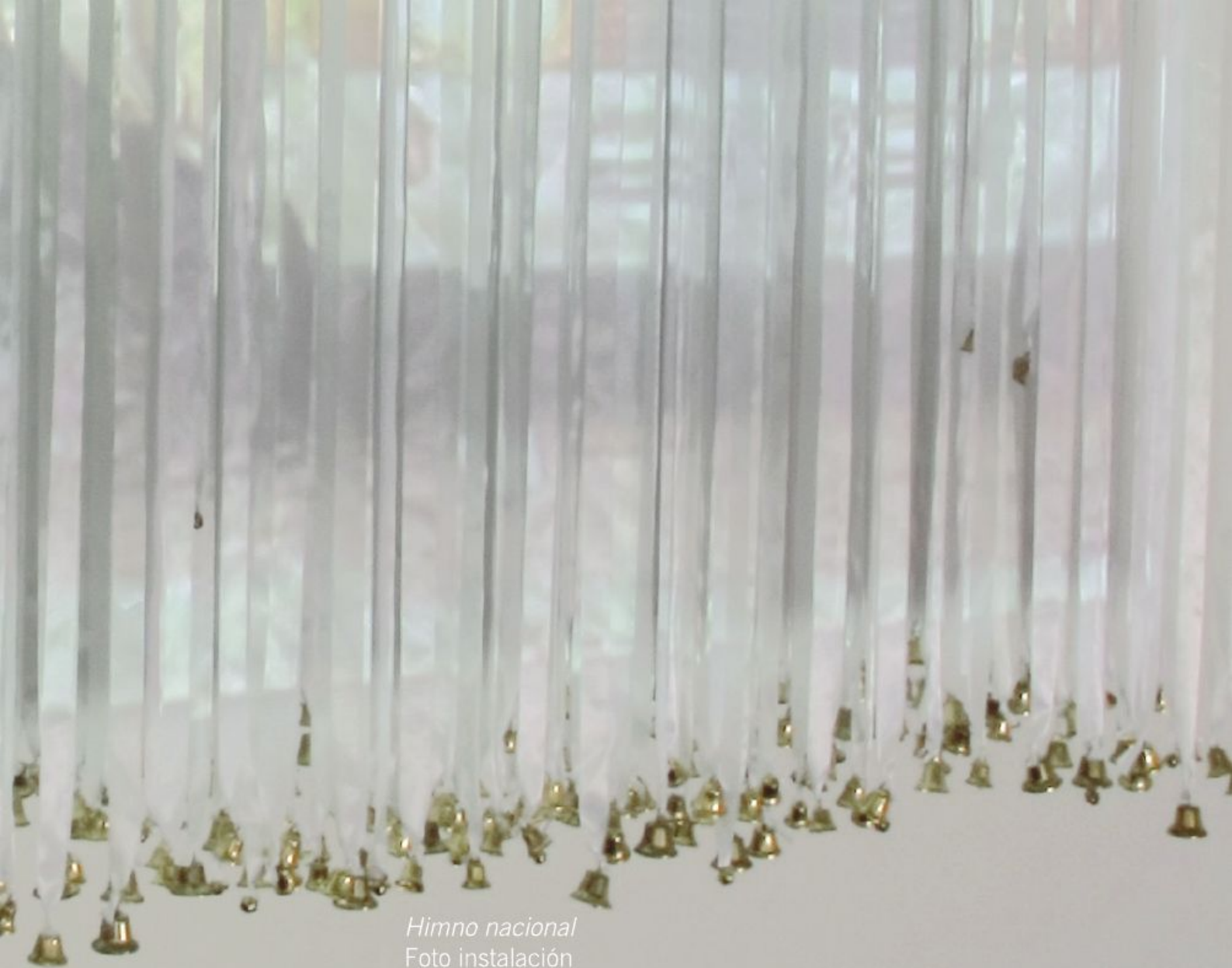
Himno nacional Foto instalación

Imágenes del blog proyectadas sobre la instalación Himno Nacional conformada por listones de seda bordados con nombres de víctimas de asesinatos y campanas suspendidas de cada listón.