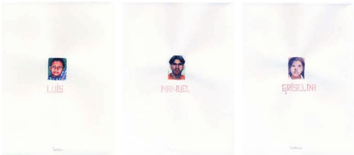
El libro de los muertos Acuarela sobre papel. 2008