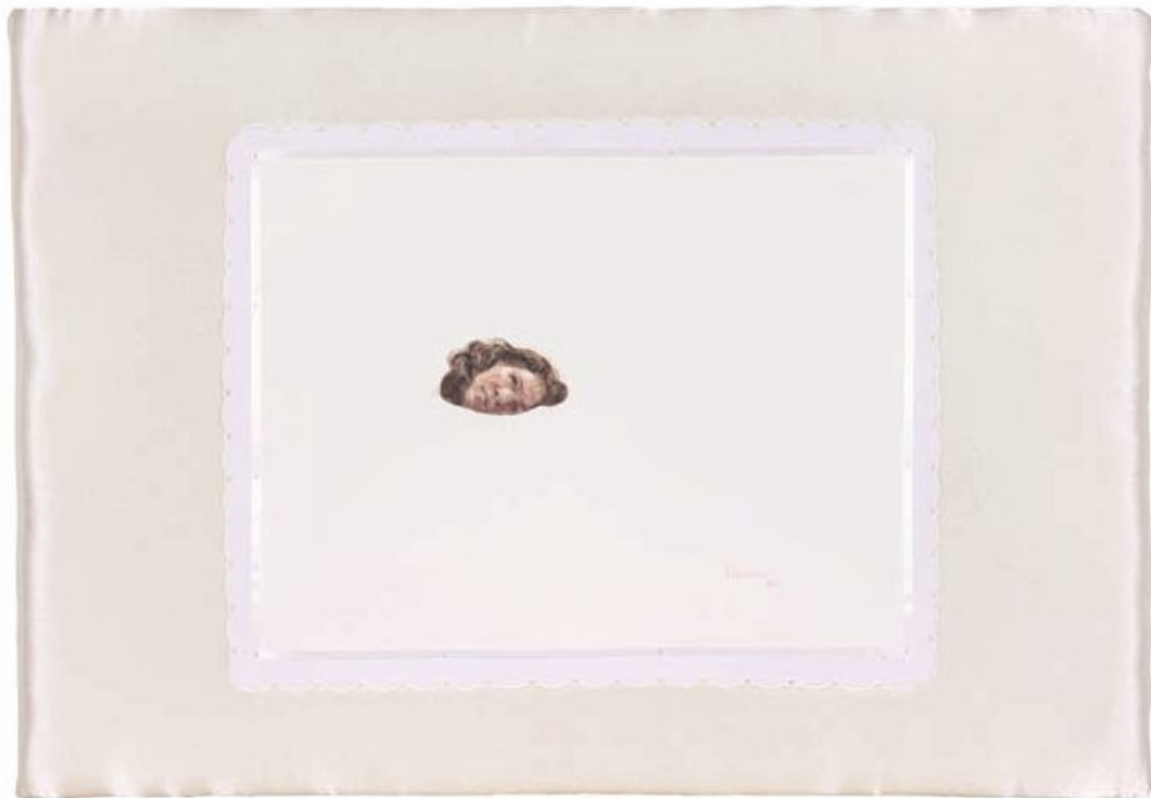
El sueño de la razón