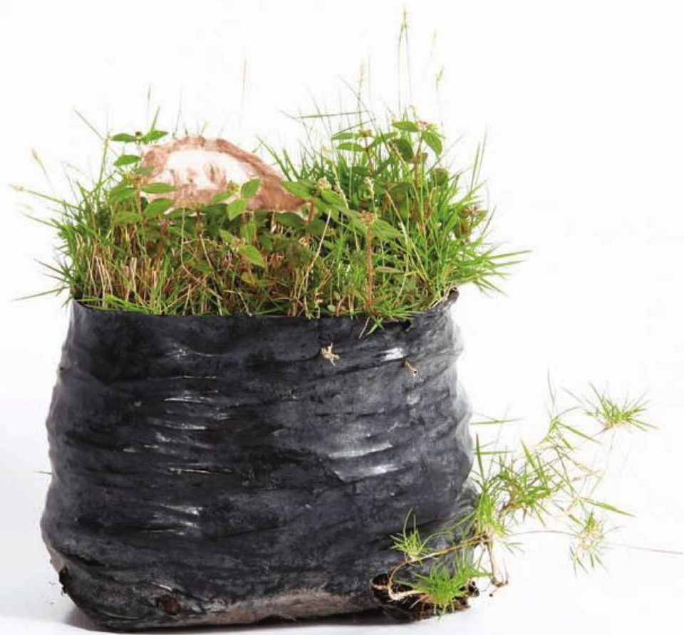
Jardín doméstico Acuarela sobre papel y materiales varios. 2008