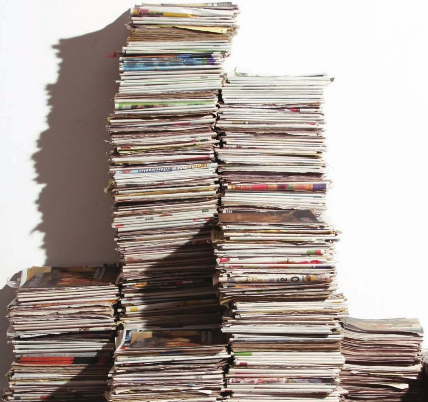
La torre vigía Instalación. 2008