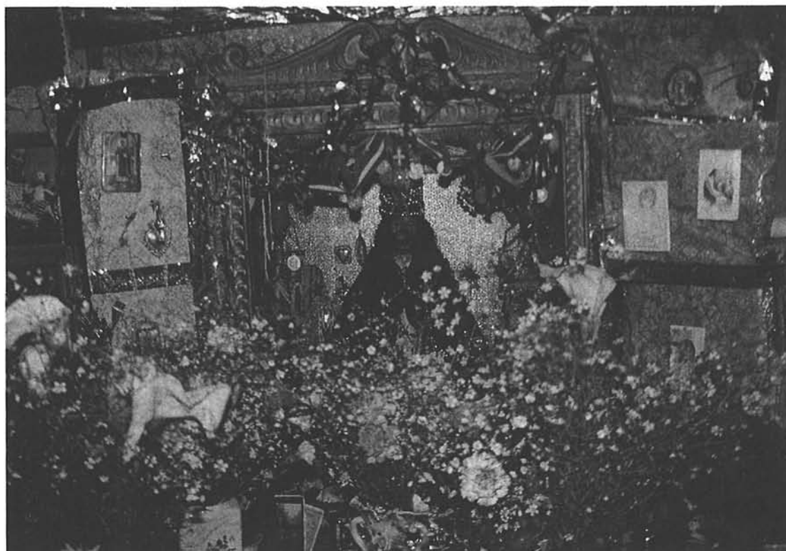
Altar de difuntos. Comunidad de Kukani Ajllata. (Titicaca, Bolivia)