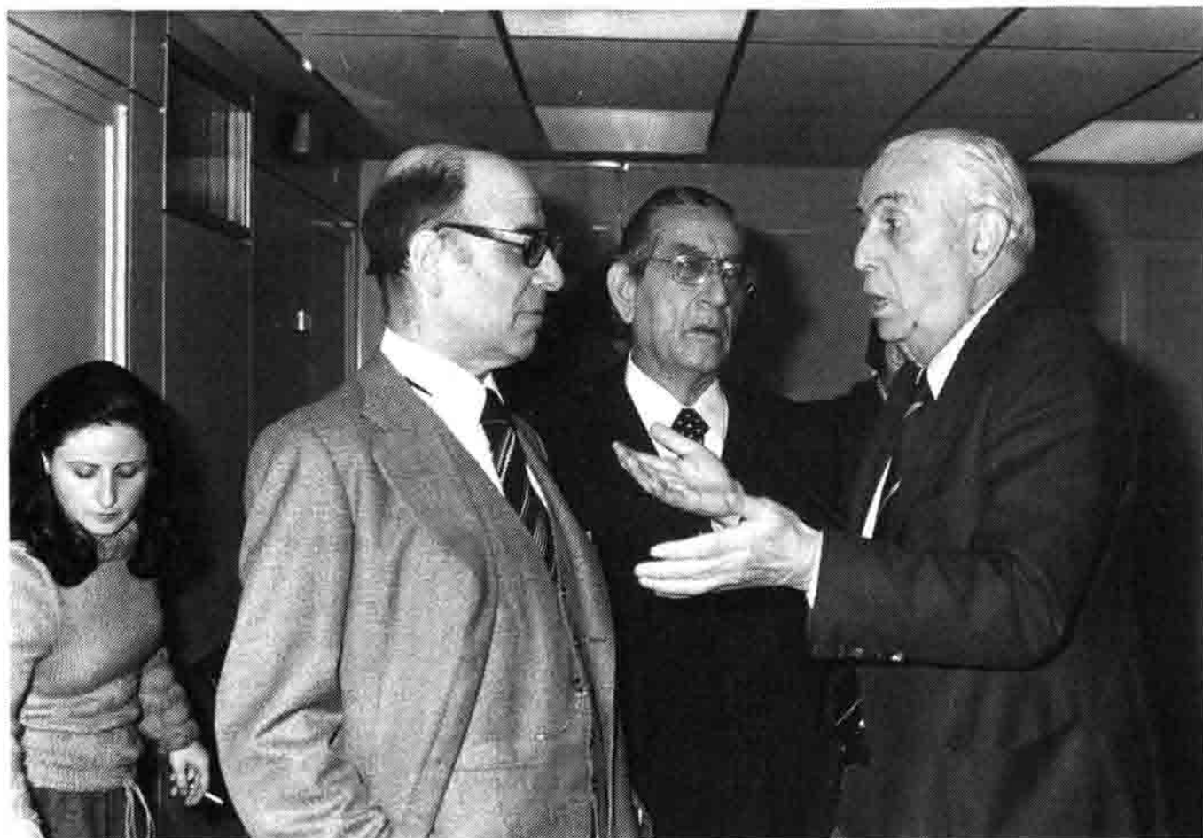
Con Antonio Tovar y Luis Rosales