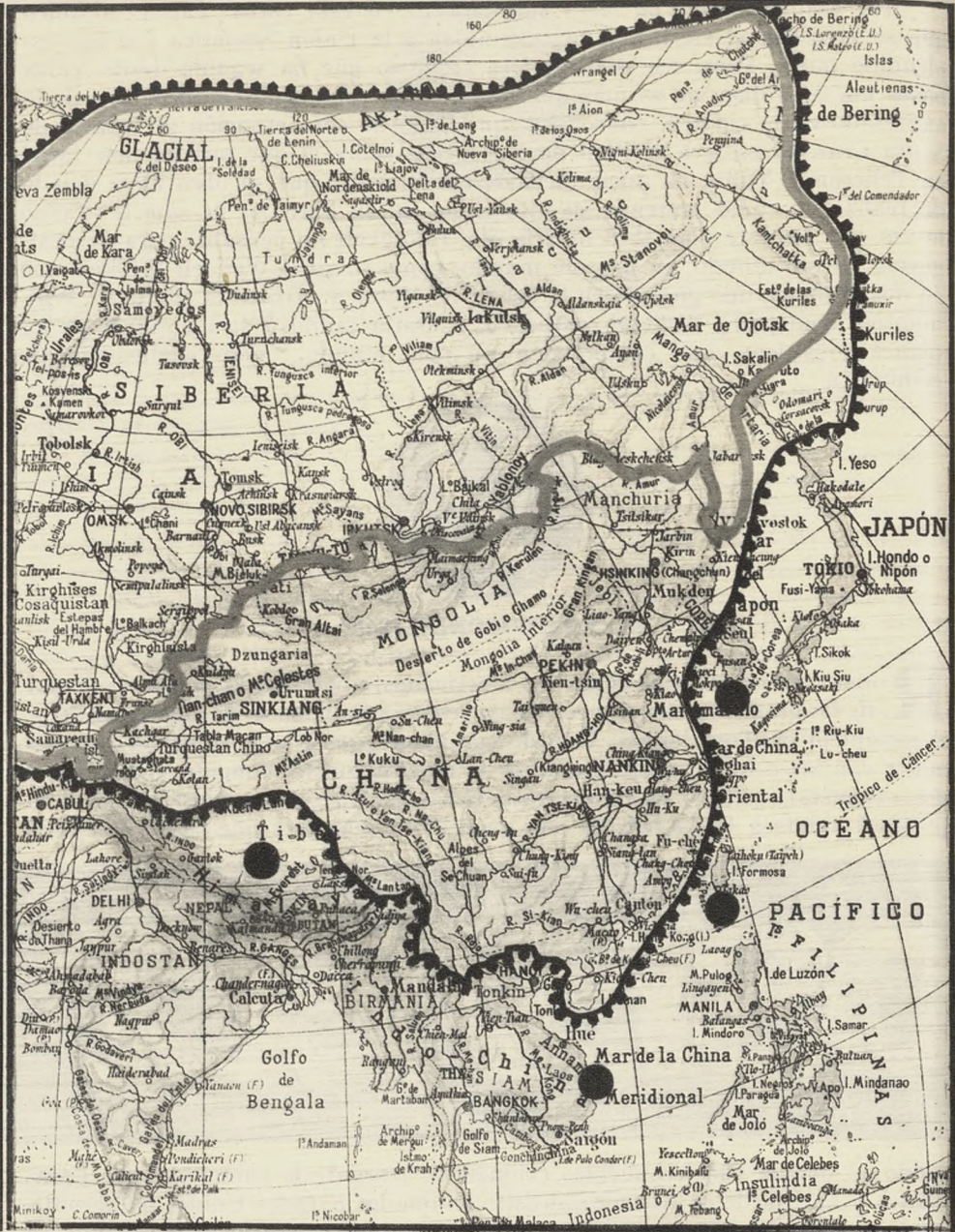
LIMITES DE LA URSS. EN 1939. TELON DE ACERO: DENTRO, LA URSS., TERRITORIOS ANEXIONADOS Y PAISES SATELITES. ZONAS DE FRICCIÓN