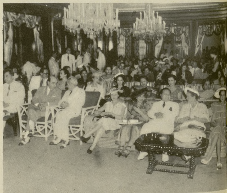
El doctor español don Carlos Blanco Soler, en su reciente viaje a Filipinas, fué portador de un mensaje del Generalísimo Franco al Presidente de la República Filipina, señor Quirino. Durante los veinte días que permaneció el ilustre médico español en la capital de las islas, pronunció brillantes conferencias y fué objeto de numerosas recepciones. En estas fotografías se recogen dos momentos de la fiesta dada en su honor en el palacio de Malacañón. Arriba: Las más destacadas personalidades de la ciencia y de la política en Filipinas, se disponen a oír el mensaje del Caudillo de España. A la izquierda: El doctor Blanco Soler, conversa con el Presidente de Filipinas, señor Quirino, y con la señora de Roxas.