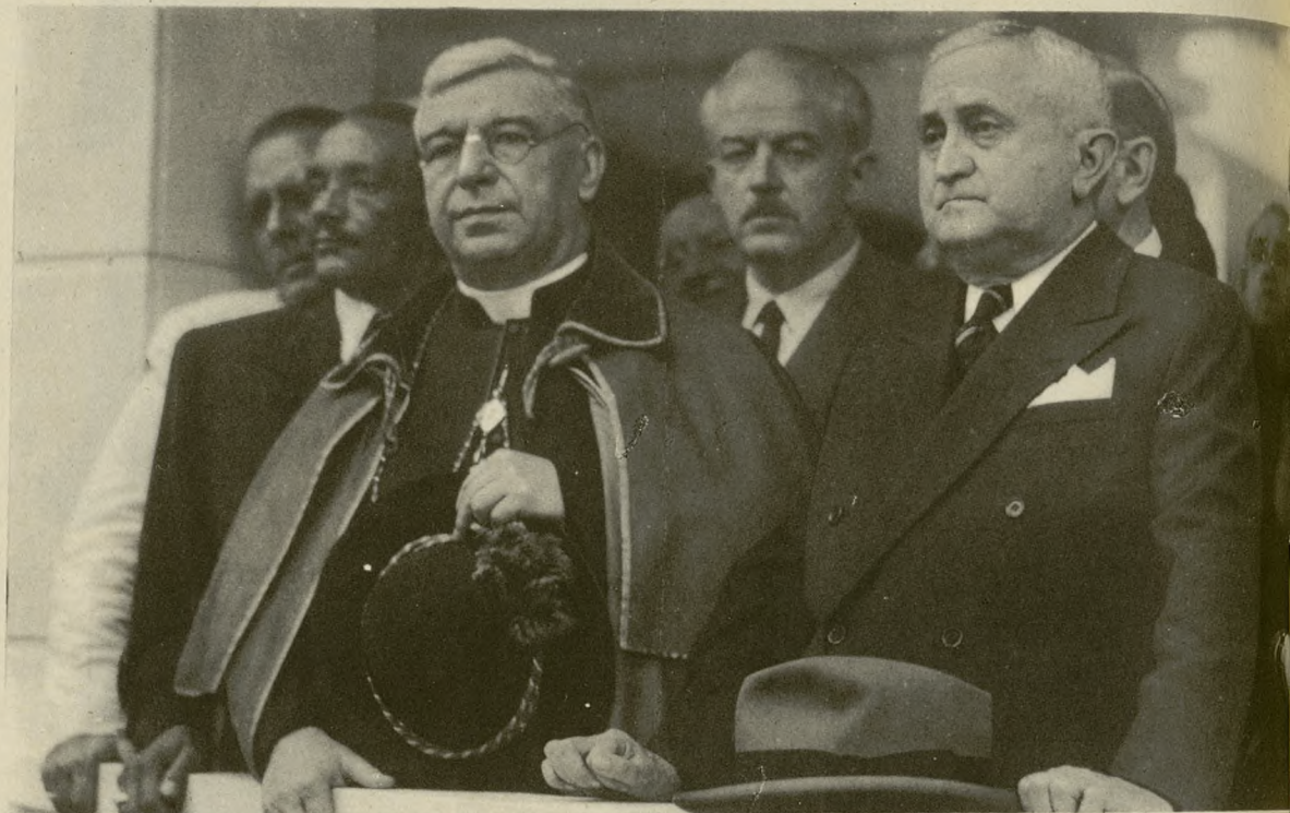
En Río de Janeiro se organizó una manifestación oficial cívico-religiosa como protesta contra la condena del Primado de Hungría, cardenal Mindszenty. Ocuparon la tribuna presidencial el Presidente de la República, Excmo. Sr. D. Eurico Dutra, el Emmo. Sr. Cardenal Primado del Brasil y el Embajador de España en Río de Janeiro, conde de Casa Rojas.