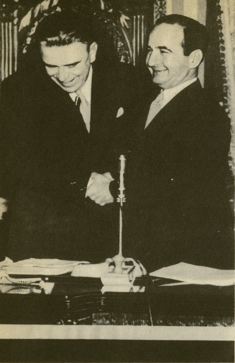
El Presidente de Costa Rica, don José Figueres (a la izquierda), abraza al nuevo Presidente electo don Otilio Ulate, en la primera sesión de la Asamblea Constituyente. Al concluir el mandato del Gobierno Provisional Revolucionario, presidido por Figueres, don Otilio Ulate se encargará de la presidencia de Costa Rica.