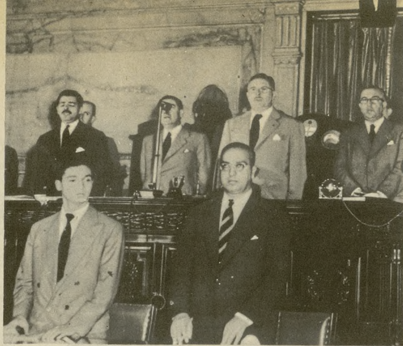
El día 16 de marzo, el Presidente Perón juró la nueva Constitución argentina.