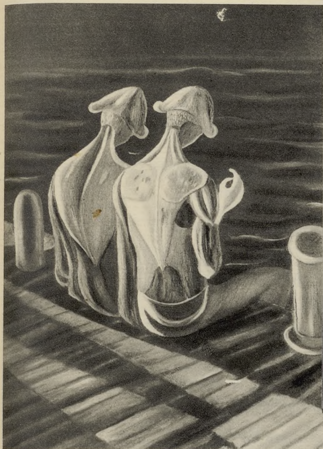
«Pescadores Nocturnos», de Carlos Augusto Cañas (San Salvador). Segundo premio: Medalla de plata y 7.500 pesetas.