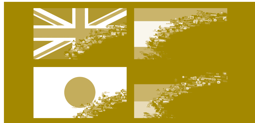
2012. Vídeo-animación, 9'