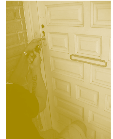
2012. Vídeo y documentación, I'