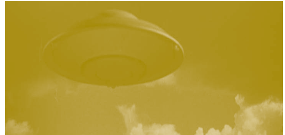
2011. Vídeo, 53"

La artista genera sus obras practicando el apropiacionismo y el doble vínculo, esto es, las situaciones comunicativas en las que recibimos mensajes diferentes o contradictorios. Como se aprecia en Mi Lucha , con gran ironía propone reflexionar sobre los pilares que nutren las democracias europeas.