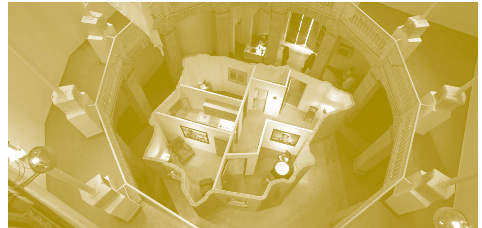
2011. Vídeo, 5'