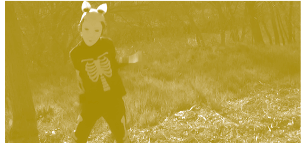
2012. Vídeo, 4'

La pieza permite volver a metodologías del pasado, incidiendo en recursos del folklore y en maestros vitales que supieron formar con creatividad. El vídeo refleja la importancia de enseñar a pensar, haciendo de la educación una herramienta de disfrute y reflexión.