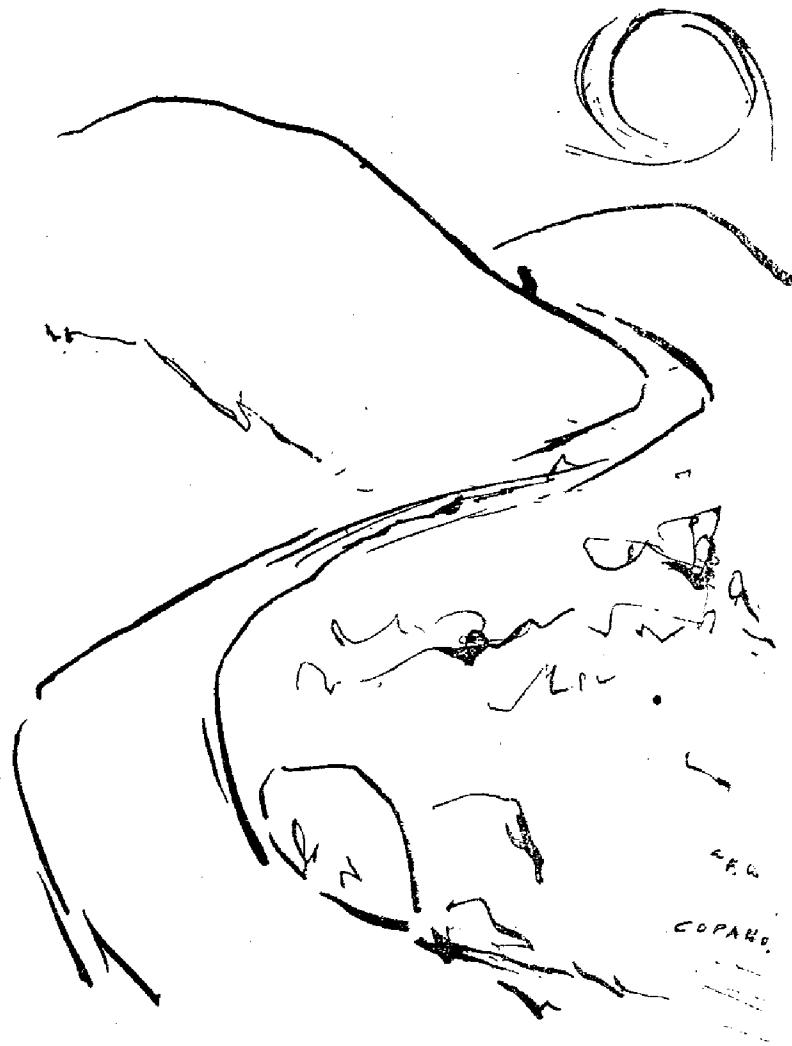
BRUJULA DE ACTUALIDAD