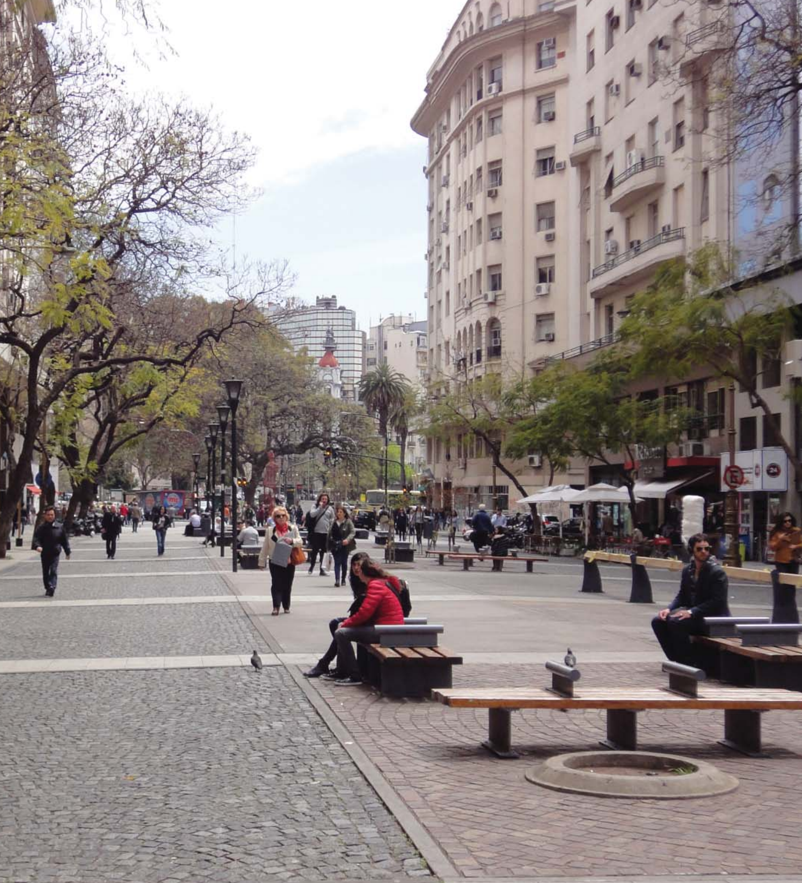
Buenos Aires (Argentina).