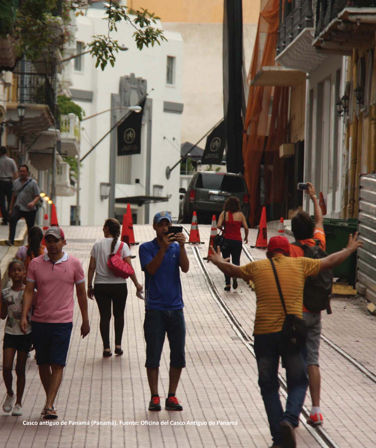
Casco antiguo de Panamá (Panamá).