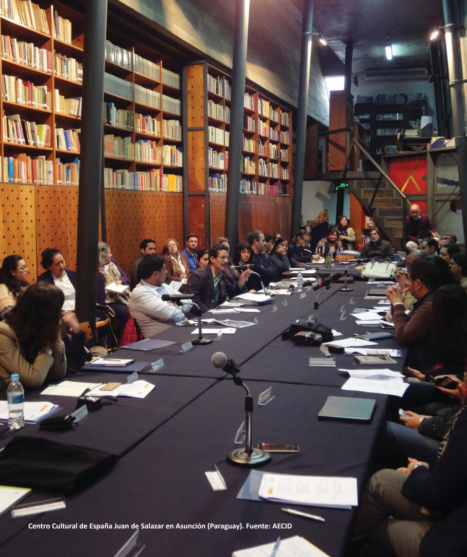
Centro Cultural de España Juan de Salazar en Asunción (Paraguay).