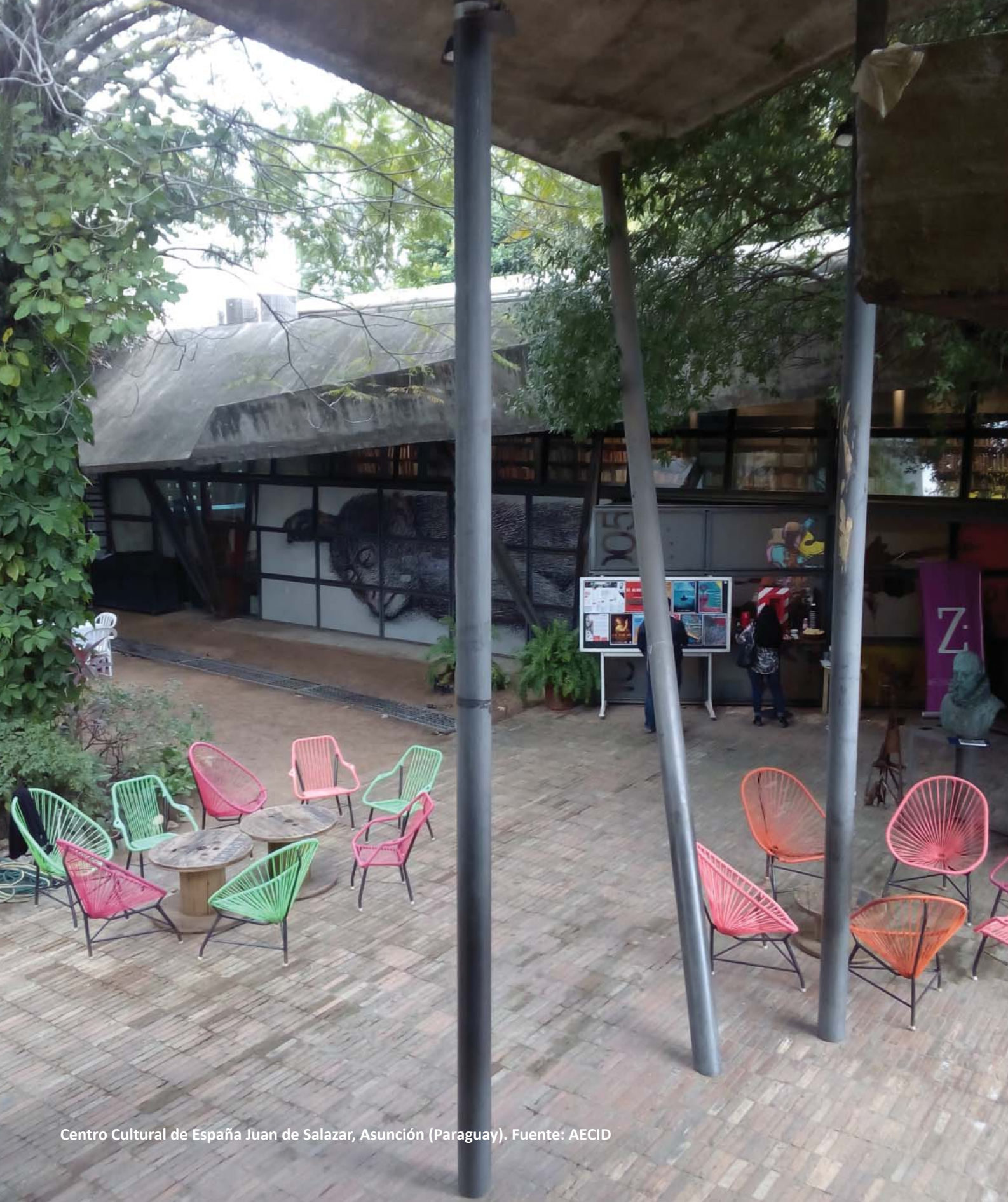
Centro Cultural de España Juan de Salazar, Asunción (Paraguay).