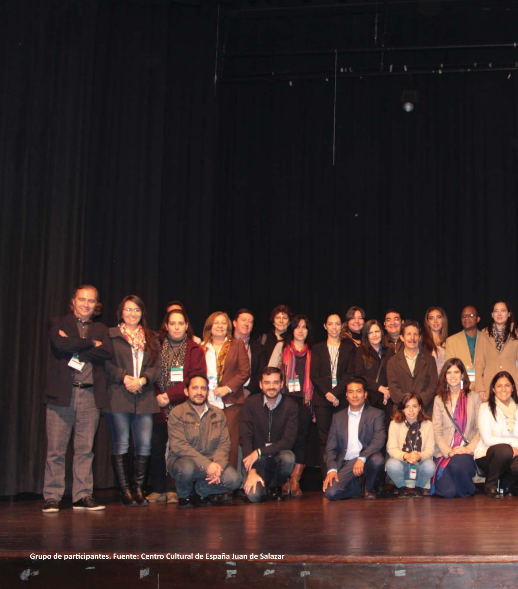
Grupo de participantes.