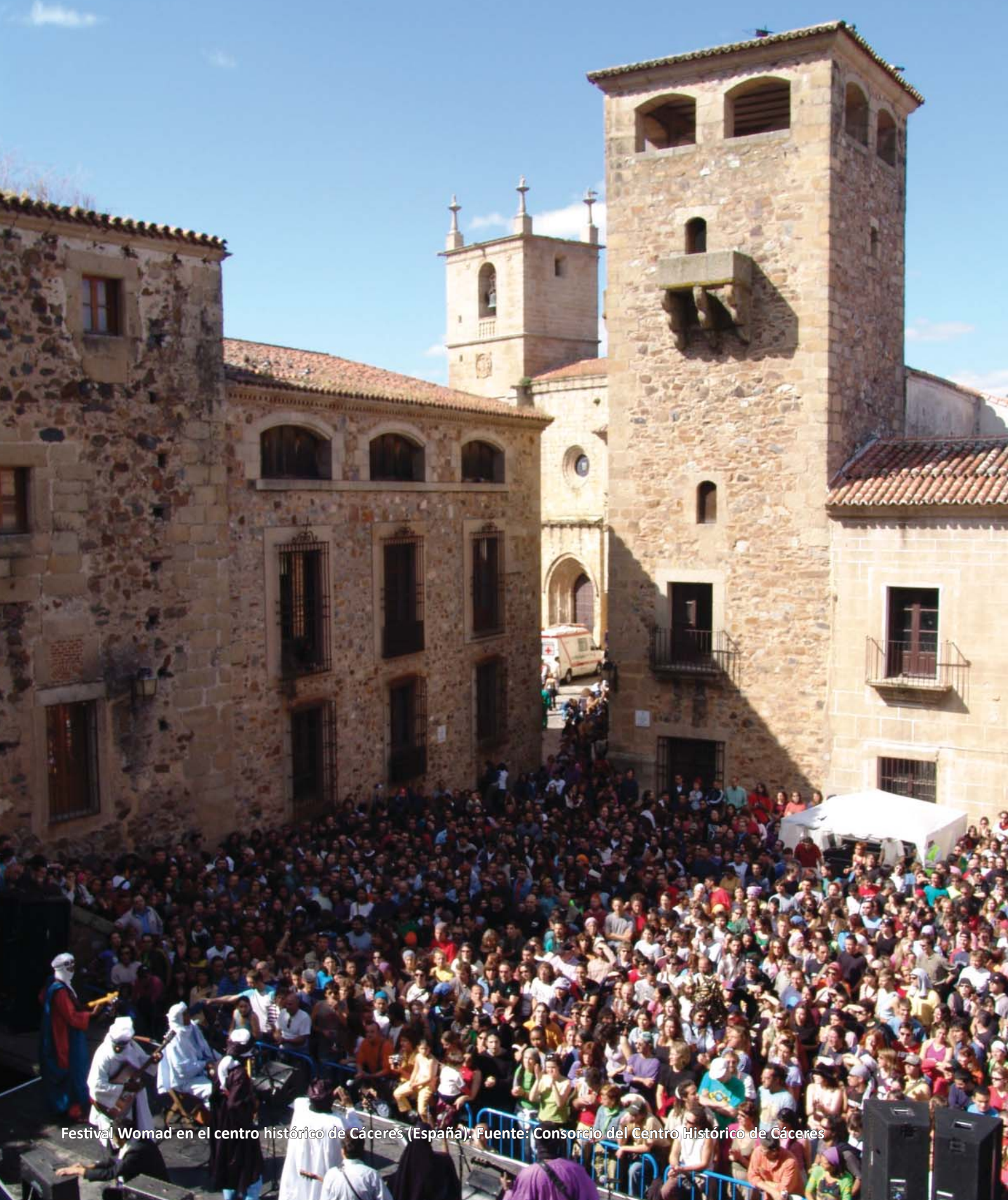
Festival Womad en el centro histórico de Cáceres (España).