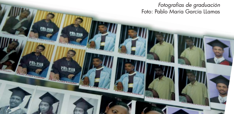
Fotografías de graduación

Con el paso del tiempo, el PCI se ha ido adaptando a los objetivos de la cooperación y a los diferentes Planes Directores, experimentando modificaciones encaminadas a mejorar la eficacia de la ayuda. Fruto de esta evolución se ha ido consolidando la necesidad de alinear la cooperación universitaria y científica con el resto de la cooperación para el desarrollo. Aunque la cooperación científica tenga sus propias especificidades, y el fortalecimiento institucional de los centros de educación superior sea un objetivo en sí mismo, es importante que los proyectos docentes y de investigación que se financien estén relacionados con áreas prioritarias para el país socio en materia de desarrollo. En cualquier caso, el conjunto de las reformas que se están llevando a cabo para mejorar la eficacia del programa responde a los trabajos de coordinación con otros actores y agentes destacados de la Cooperación Científica para el Desarrollo como el Ministerio de Ciencia e Innovación, el Consejo Superior de Investigaciones Científicas (CSIC), el Ministerio de Educación y las Universidades y otras instituciones con competencias en la materia.