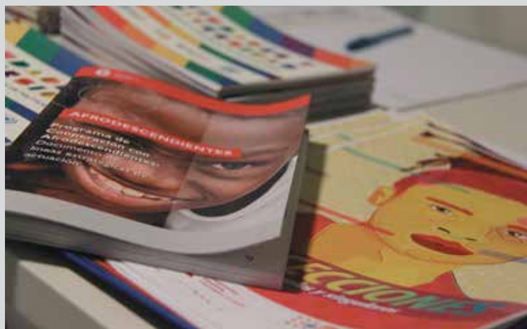
Mesa de materiales en el diálogo «Afro LGBTI», quizá el más potente de los debates, en el mes de julio.