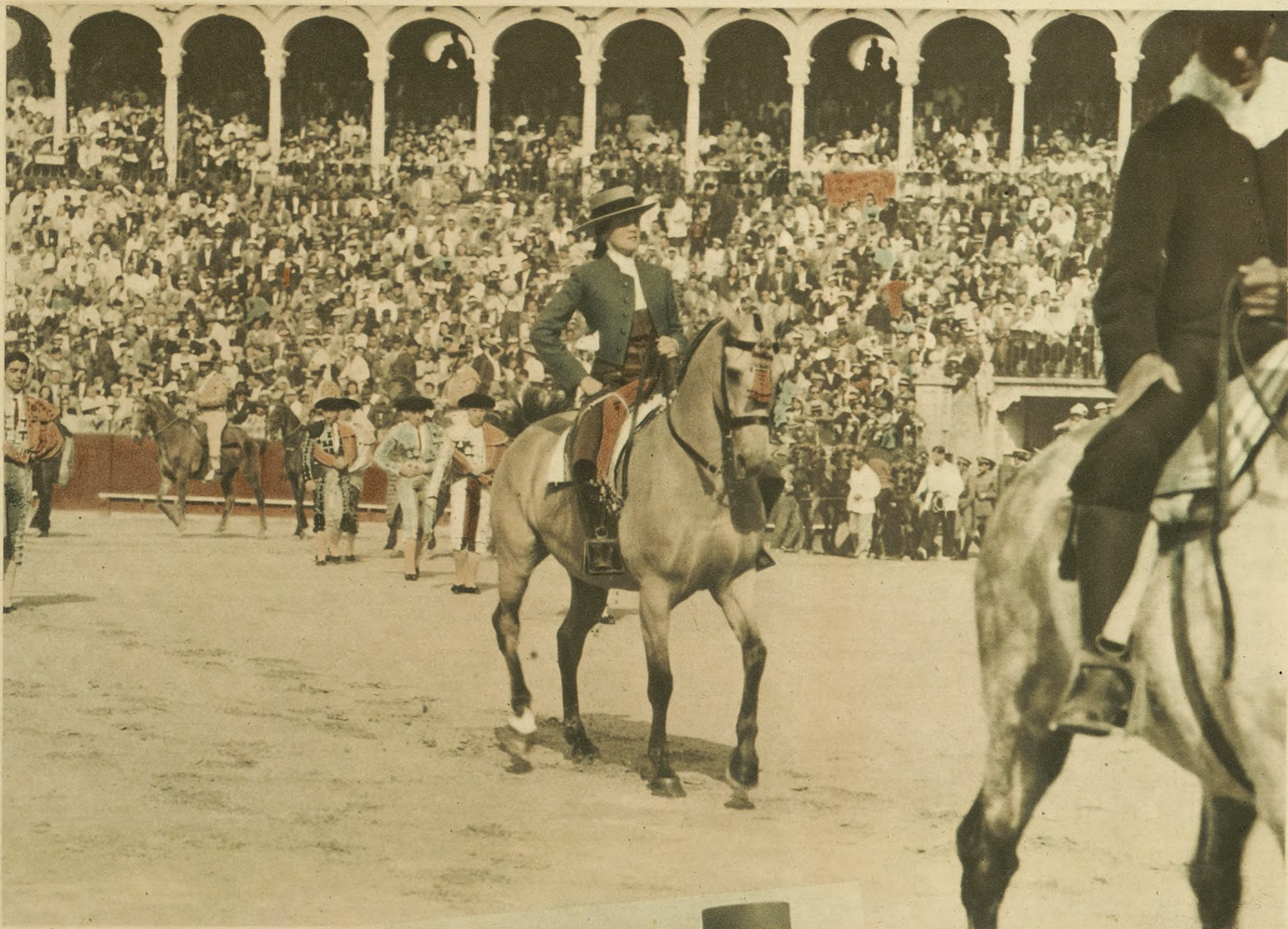
Abril de 1945. Ferias de abril en Sevilla. Corridos de las ferias. Plaza de toros de la Real Maestranza: plaza de abo-lengo, de tradición taurina. En las ferias de abril en Sevilla y en la Plaza de la Maestranza, en 1945, hizo su presenta-ción en España la gentil y magnífica rejoneadora peruana Conchita Cintrón. La fotografía superior recoge este momen-to inaugural: al frente de las cuadrillas, la extraordinaria ca-ballista del Perú va, por vez primera, sobre la arena de un ruedo español