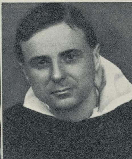
El problema del P. Dubarle, dominico francés, teólogo y físico atómico, es el problema de la amistad de la fe y la ciencia... La ciencia atómica en este caso.