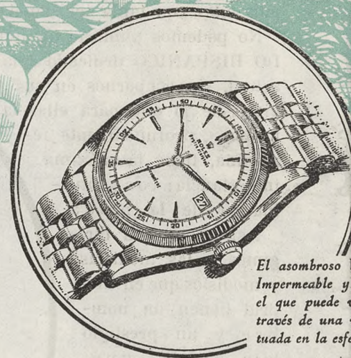
El asombroso ROLEX DATEJUST. Impermeable y Automático en el que puede verse la fecha a través de una ventanilla situada en la esfera.