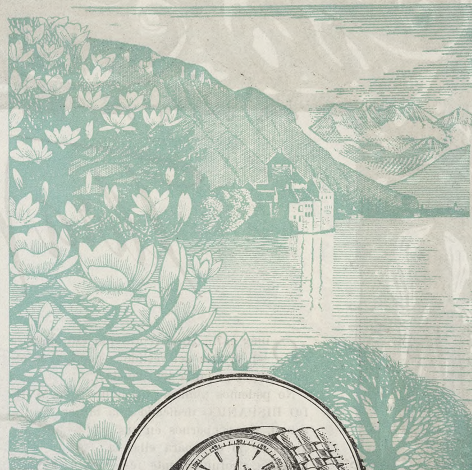
MONTREUX Castillo de Chillon