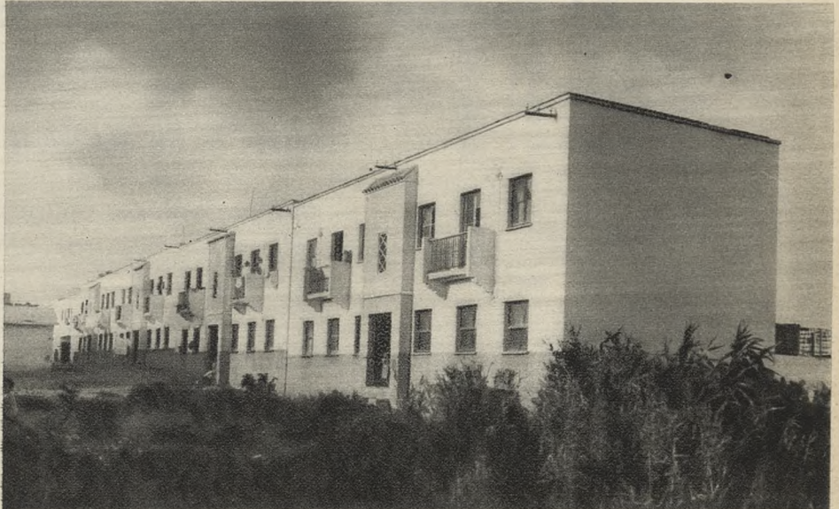
El Patronato ha alzado en Cádiz este grupo de veinte viviendas ultraeconómicas, pequeña parte del plan destinado a solucionar definitivamente este problema.