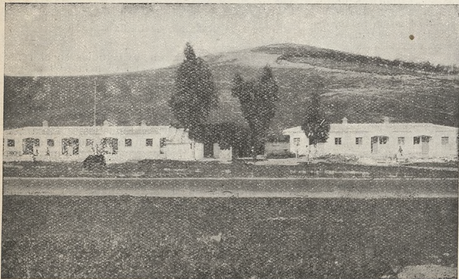
La lucha contra el chozo. Cerca de Jerez se veían unas barracas como la que aun se aprecia en nuestra "foto". El Patronato las va substituyendo por excelentes edificaciones.

Así, entre la gran protección estatal y la artesana tarea del Patronato Social «José Antonio», sigue Cádiz su singlatura por la Historia, vieja, sí, más vieja que ninguna otra tierra de Occidente. Pero con la alta mirada de los pueblos que se saben en la ruta verdadera y avanzan mirando de frente al sol.