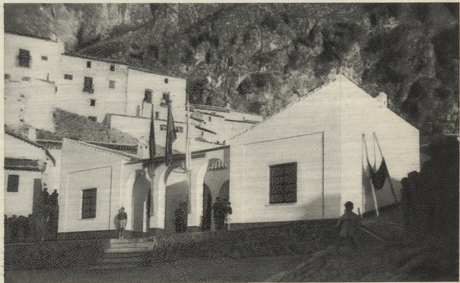
En Zahara de la Sierra se ha edificado, como en tantos otros pueblos gaditanos, un hogar para que las juventudes rurales tengan donde reunirse a descansar.