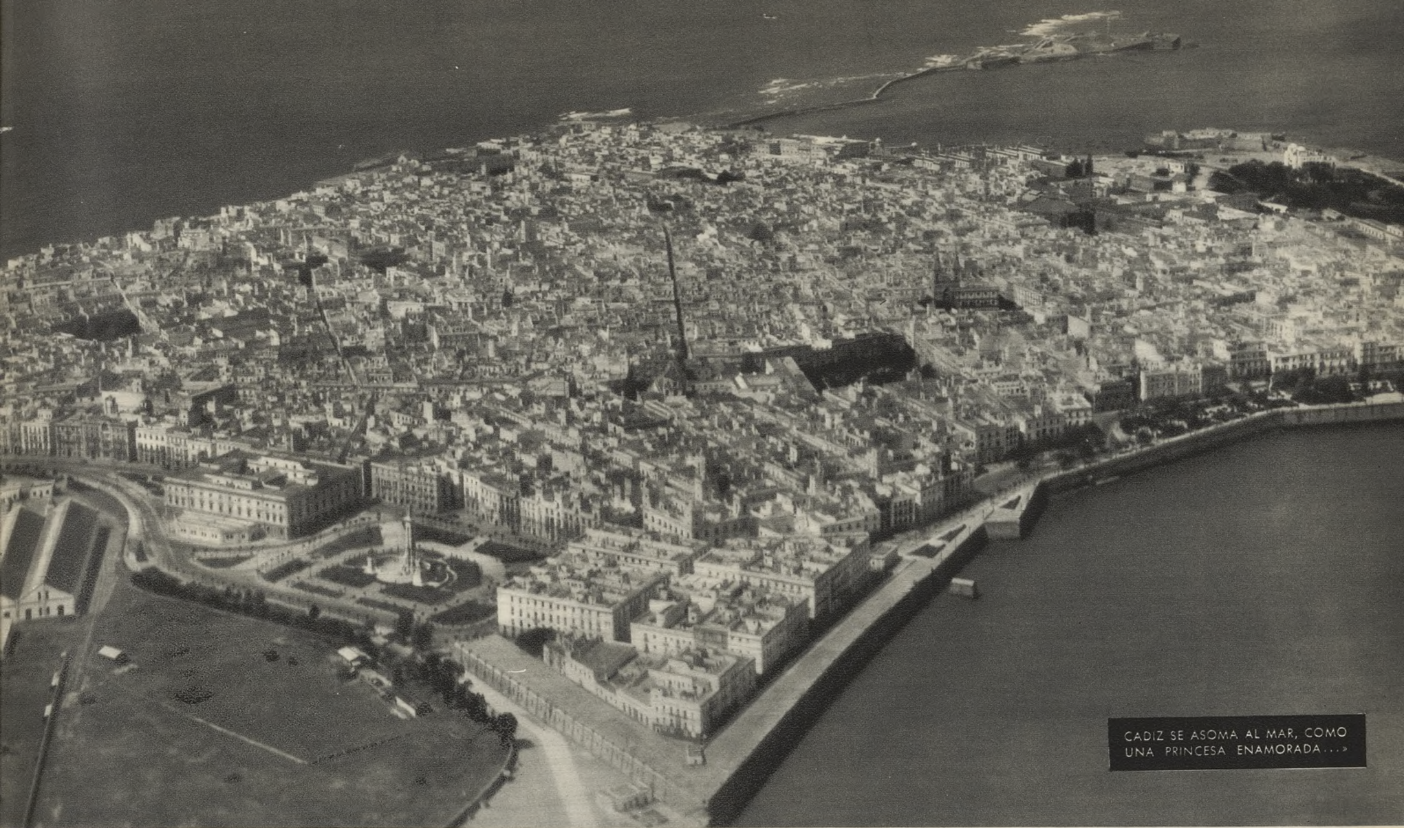
CADIZ SE ASOMA AL MAR, COMO UNA PRINCESA ENAMORADA...