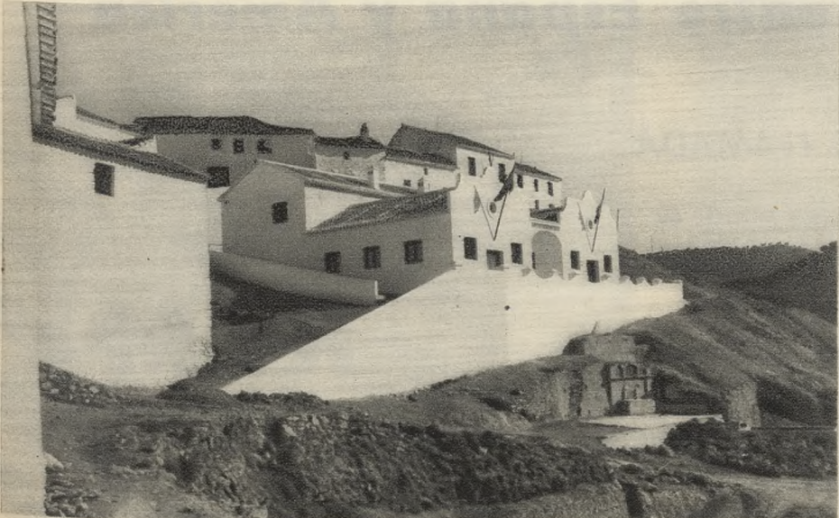
En Torre Alháquime, en la punta de la provincia, metido en la sierra, se alza este grupo escolar para niños, construido por el Patronato Social «José Antonio».