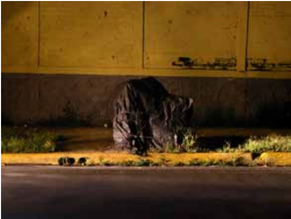
Mobiliario [German Hernández] Foto instalación

Fotografías digitales impresas en papel fotográfico, montadas en foamboard