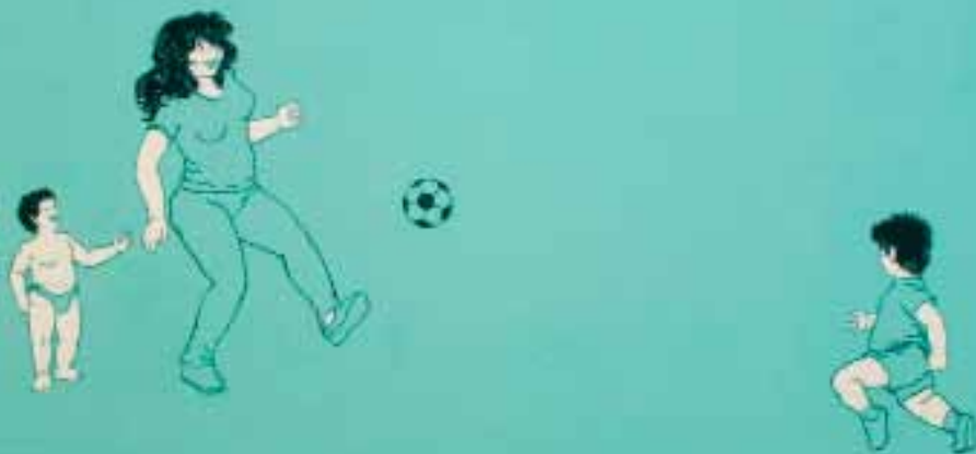
Fragmento Familiar [Jaime Izaguirre] Óleo sobre pared preparada