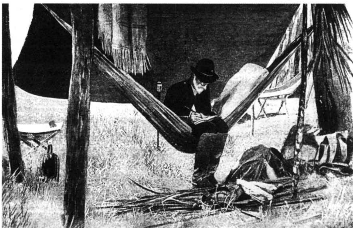
El generalísimo Máximo Gómez en su tienda de campaña.