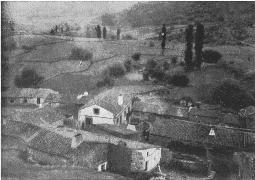
Navalsáuz, donde Rubén Darío estuvo por vez primera en 1899