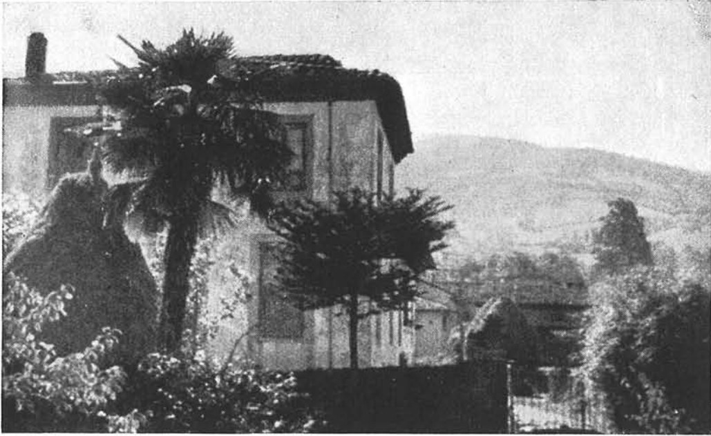
Casa de Monterrey (Asturias), donde vivió Rubén en 1908 y 1909