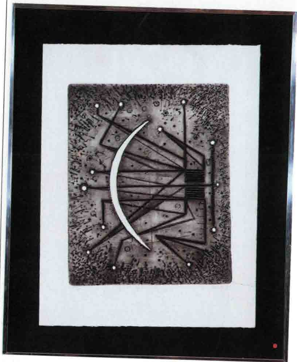
Mastroiani II Grabado al plomo 1967