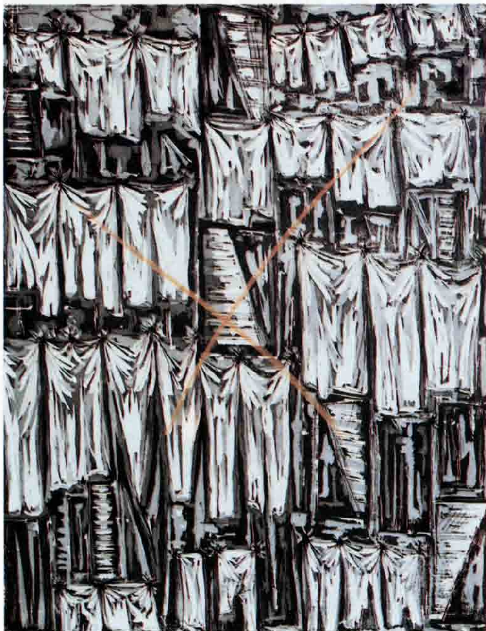
Si proibisce di buttare immondizie Grabado al plomo