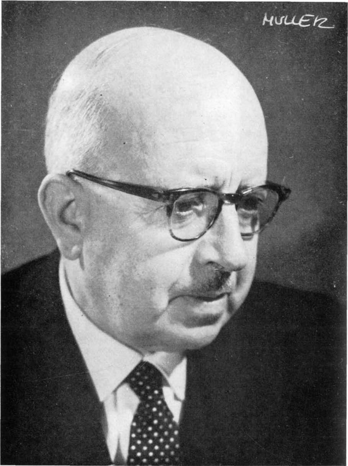
DÁMASO ALONSO, elegido por unanimidad director de la Real Academia Española